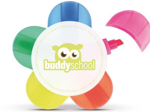
Kuva 4. Buddyschool korostuskynä

ne luovat kantajansa avulla näkyvyyttä toiminnalle, missä oppilaat ikinä liikkuvatkaan sonnustautuneina tuotteisiin.