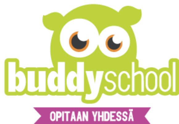
Kuva 2. Buddyschool logo ja slogan

Omasta mielestämme ja kuten myös kontekstuaalinen suunnittelumenetelmä tukee, kaikin puolin onnistunut ulkoasu on projektin menestymisen kulmakivi. Logon tulee olla erottuva ja sen tulee kuvastaa hanketta ja sen tarkoitusperää. Tässä onnistuimme luomalla olion joka, on hellyttävä ja helposti lähestyttävän oloinen kuitenkin olematta liian lapsellinen. Värimaailmaksi valitsimme kellertävään taivuttavan vihreän, joka on rauhallinen ja pehmeä väri. Logovaihtoehtoja oli useita ja siksi kävimme muutamissa kouluissa kysymässä mielipiteitä opettajilta ja oppilailta. Huomasimme nopeasti, että toimivin lähestymistapa ja parhaiten saimme vastauksia, kun laitoimme nuoret äänestämään pienemmissä ryhmissä mistä he eniten pitivät ja helpommin avautuivat kertomaan syyn, miksi joku tietty logo oli parempi kuin toinen. Näiden haastattelu- ja kyselytuokioiden pohjalta valitsimme logon, johon nimi oli liitettynä. (kuva 2).