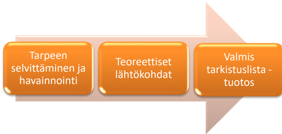
Kuvio 2. Opinnäytetyön eteneminen.