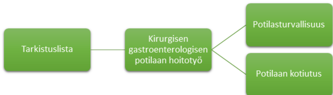
Kuvio 1. Käsitteet.

Tarkistuslistan tavoitteena on turvata potilasturvallisuus ja helpottaa hoitajien työtä niin osastolla, kuin potilaan jatkohoitopaikassa (Kuvio 1). Tarkistuslistan tavoitteena on myös yhtenäistää hoitoa, sillä aina ei voida taata saman hoitajan jatkavan potilaan hoitoa seuraavassa vuorossa. Tarkistuslistan avulla osasto voi myös yhtenäistää rakenteista kirjaimista potilaasta ja tarkistuslista antaa viitteitä oleellisimmista kirjattavista asioista.