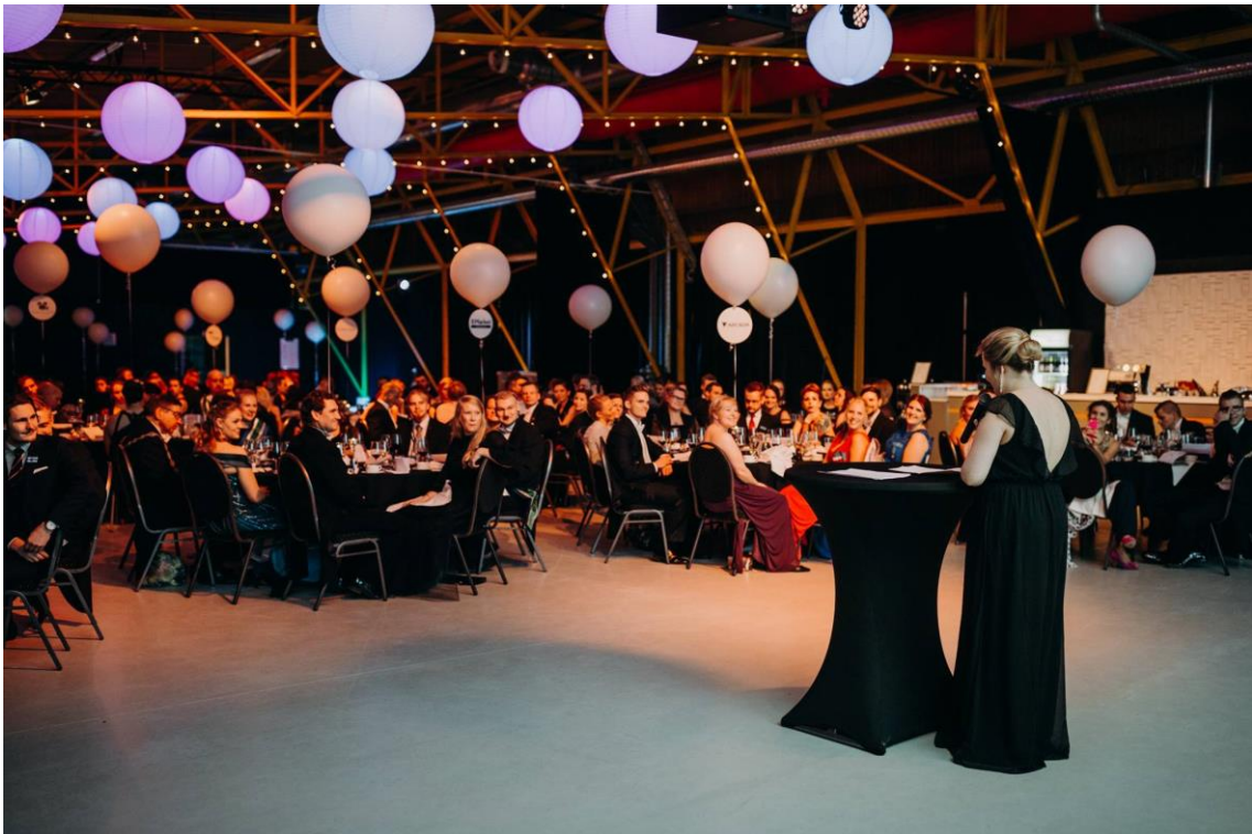
Figur 8. Överblick av festsalen.

Dörrarna öppnades för gästerna kl. 16.45 och vid ingången till Wirtaamo salen stod värden och värdinna och tog emot gästerna medan serveringspersonalen serverade skumvin. Vid ingången fanns en obehövad self service garderob, vilken fungerade bra och inga