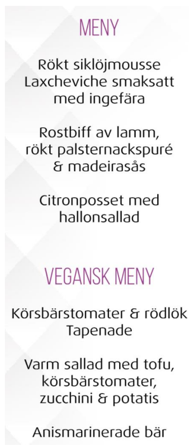
Figur 2. Meny på årsfesten. (Årsfestkommitteen. 2017)

I början av februari var jubileumskoordinator Harf en gång och titta till lokalen och diskuterade lokalen, inredningen, belysningen, tekniken, upplägget och serveringen. 21.3.2017 var årsfestkommitteen och provsmaka på menyn som vi fått i samband med offerten i början av februari. Under provsmakningen gjordes små finslipningar till menyn. Den slutliga menyn bestod av rökt siklöjmousse och laxcheviche till förrätt, rostbiff av lamm med madeirasås till huvudrätt och citronposset med hallonsallad till efterrätt. Att välja lamm som huvudrätt för så stor mängd människor kändes en aning riskabelt men Koskenrantas bra rykte, erfarenhet och kvalite på maten tryggade årsfestkommitteen att välja detta. Ett vegetarisk alternativ valdes naturligtvis också som blev körsbärstomater, lök och tapenade till förrätt, varm sallad med tofu, körsbär, zucchini och potatis till huvudrätt och anismarinerade bär till efterrätt. Den vegetariska menyn var det fakto helt och hållet veganskt vilket underlättade beaktandet av eventuella allergier och dieter.