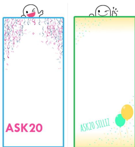
Figur 5. Geofilter för ASK 20. (Årsfestkommitteen, 2017)

Till själva jubileumsårsfesten och sillfrukosten skapades en hashtag, #ask20, för att skapa synlighet under båda evenemangen och hashtaggen användes det fakto relativt aktivt. För både jubileumsårsfesten och sillfrukosten skapades också egna geofilter för var sitt evenemang i Snapchat med syfte att få synlighet via den kanalen också. Detta var något som inte prövats på tidigare, men verkade lyckas riktigt bra och folk hittade geofiltrarna.