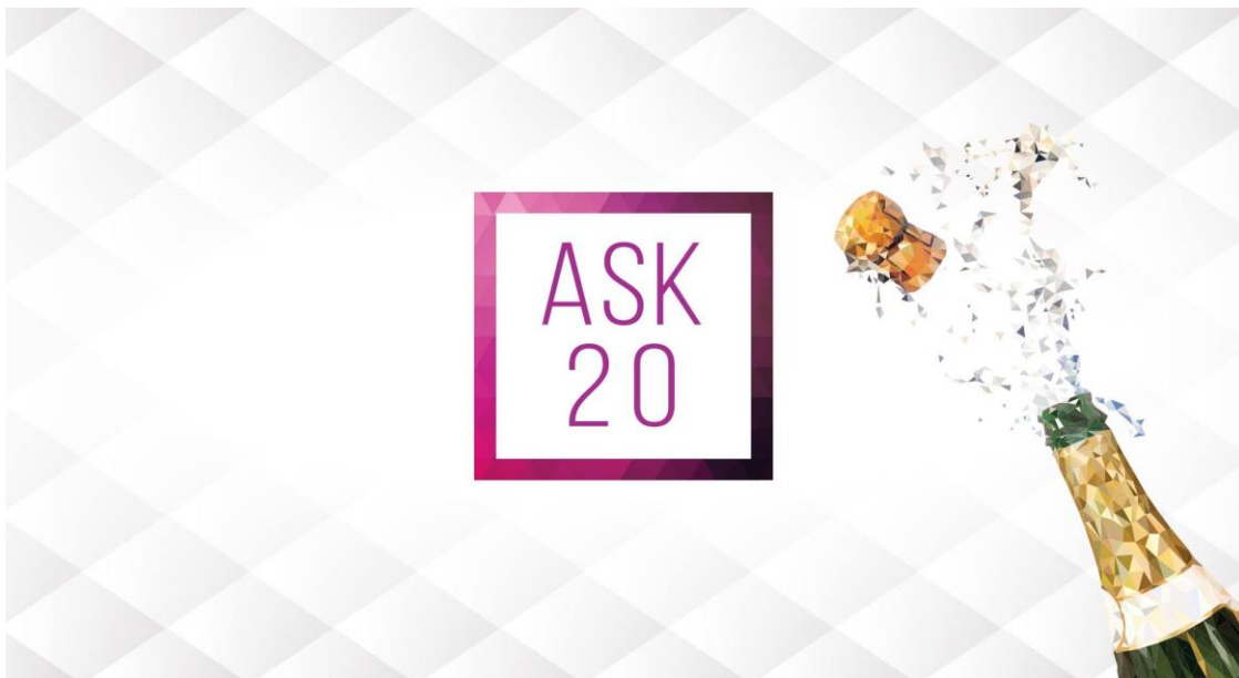
Figur 1. Marknadsföringsmaterial. (Årsfestkommitteen, 2017)

I detta kapitel kommer arbetsprocessen för ASK 20-års jubileumsårsfest presenteras i sin helhet, från definitionsfasen till planeringsarbetet och genomförandet av jubileumsårsfesten. Arbetsprocessens framskridning beskrivs i härpå följande delfaser och slutligen utförs en evaluering av arbetsprocessen samt en reflektion över hur målen uppnåddes och själva evenemanget lyckades.