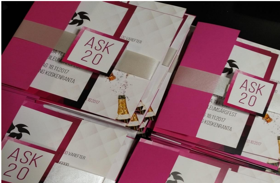
Figur 4. Inbjudningar. (Årsfestkommitteen 2017.)

Även själva Facebook evenemanget för såväl jubileumsårsfesten och sillfrukosten skapades, för jubileumsårsfesten skapades evenemanget den 29. september och för sillfrukosten den 3. november. Båda fungerade som informationskanaler, och till evenemangen bjöds studeranden från Arcada och andra högskolor samt Arcadas personal och alumner. Eftersom gästerna kunde preliminärt anmäla sig som deltagande hjälpte det med att estimeras antalet slutliga anmälningar. Även ASK egen Facebooksida användes för att distribuera information. Såväl på ASK egen Facebooksida och evenemangen på Facebook uppdaterade årsfestkommitteen bl.a. påminnelser angående anmälningstiderna. Instagram användes också aktivt, men där påminde man mest om anmälningstiderna.