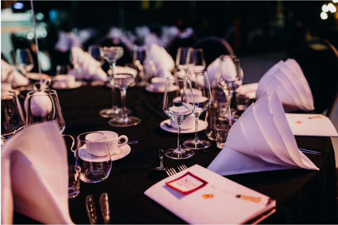
Figur 7. Dukning.