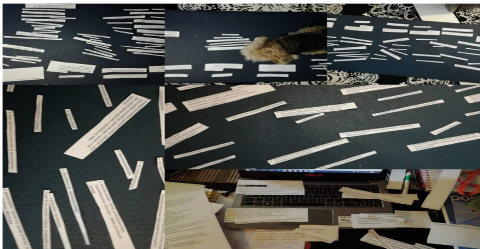
Kuva 3 Teemat

Seuraavaksi jaoin samansisältöiset maininnat kategorioiden alle omaksi luettelokseen. Analyysiä tein induktiivisesti ja kunkin kategorian nimesin sisältöteemoja yhdistävin käsittein. Aineiston analysointi tuotti erilaisia palvelukuvauksia tai niihin rinnastettavia käsitteitä yhteensä 58. Jotkin käsitteet esiintyivät useammassakin aineiston tutkimuksessa, esimerkkeinä mainittakoon osallistumis- ja harrastusmahdollisuus, läheisverkosto ja palveluohjaus. Toiset käsitteet puolestaan nousivat esiin vain kertaalleen, tällaisia olivat esimerkiksi whatsapp-tilit sosiaalipalvelun työntekijöille ja ystävällisemmän ja iloisemman palveluasenteen toivominen. Nämä 58 käsitettä kategorioin viiden yläotsikon alle (lasten ja nuorten palvelut, nuorten ja nuorten aikuisten palvelut, lapsiperhepalvelut, ammatillinen orientaatio ja palveluiden saavutettavuus), jotka puolestaan jaoin kahden eri teeman (lasten, nuorten ja lapsiperheiden palvelut sekä palveluntuottajat) alle. Pääteemana on palvelujärjestelmä. Käytännössä tämä tapahtui leikkaa-liimaa -menetelmää käyttäen tietoteknisten taitojeni puutteellisuuden vuoksi (kuva 3). Teemat ja tyypit olivat myös helpompi hahmottaa, kun niitä saattoi yhdistellä ja muokata helposti paperilapun paikkaa vaihtamalla. Teemat tyypittyivätkin lopulta aivan erilaisten kategorioiden alle, kuin olin alun perin ajatellut. Kategoriat teemoineen (kuva 4) käsittelen syvemmin tulokset-osiossa.