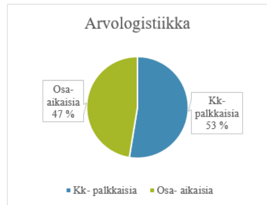
KUVIO 2. Työsuhteiden osuudet arvologistiikassa

Työsuhteiden muuttumista kuukausipalkkaisista työsuhteista osa-aikaisiksi työsuhteiksi on tapahtunut yrityksen olemassaolon aikana runsaasti ja kehityksen suunta jatkuu yhä edelleen. Työsuhdemuotona kuukausipalkkaiset muodostavat yhä enemmistön mutta arvologistiikassa osa-aikaisten työsuhteiden määrä on jo lähellä puolta. Osa-aikaisia työsuhteita tehdään tyypillisesti työuran alkuvaiheessa ja työ sopimuksen mukaisten työtuntien määrää lisätään työuran edetessä. Myös perhevapailta työelämään palaavien työntekijöiden on havaittu toivovan 3- tai 4-päiväistä työviikkoa entisen 5-päiväisen työviikon sijaan. Tämä on ymmärrettävää pienen lapsen hoidon järjestämiseksi ja myöhemmin koulun aloittamisen tukemiseksi.