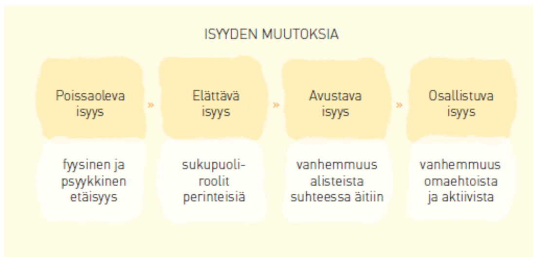
Kuva 1: Isyyden muutoksia. Pernu & Pohjola 2011

Kuten Mykkänen ja Aalto, myös Pernu ja Pohjola (2011) ovat kuvanneet isyyden muutosta hyvin samantapaisesti. He ovat käyttäneet termeinä poissaolevaa isyyttä, elättävää isyyttä, avustavaa isyyttä ja osallistuvaa isyyttä, joka on kuvattuna seuraavassa kuvassa (Kuva 1).