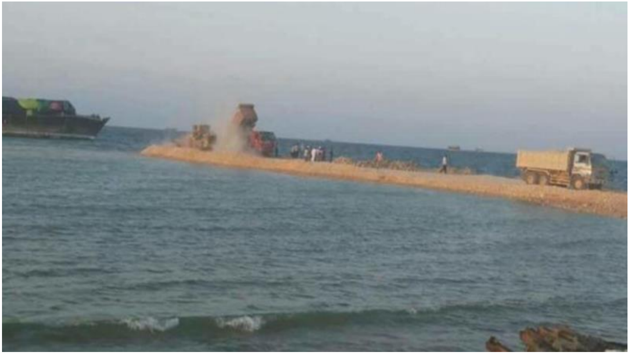
Kuva 1. Tavalliset kaupunkilaiset pelastavat karille menneen laivan rannan tuntumassa.