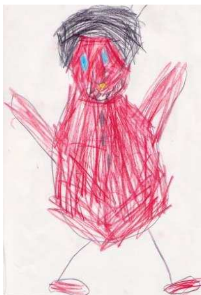
KUVA 2. Alvari-perhetyöntekijä

Analysoimme haastatteluaineiston teemoittelemalla äitien, lasten ja työntekijöiden vastaukset erikseen, mutta samalla teemoittelulla. Käytimme aineiston analyysissa ja jaottelussa siitä nousseita teemoja, joita olivat työskentelyprosessi, työntekijöiden valmiudet, lasten osallisuus ja vanhemmuuden tukeminen. Näiden teemojen avulla pyrimme löytämään vastauksia tutkimuskysymyksiimme kehittämisideoista ja lasten näkyvyydestä Alvari-perhetyössä. Analyysin tulokset ovat pääasiassa vuoropuhelua äitien ja työntekijöiden vastauksista nousseiden kokemusten välillä.