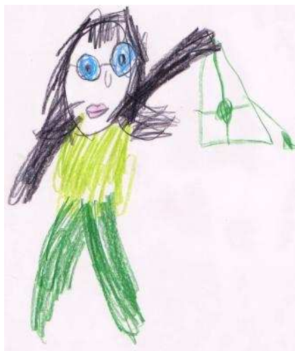
KUVA 3. Alvari-perhetyöntekijä