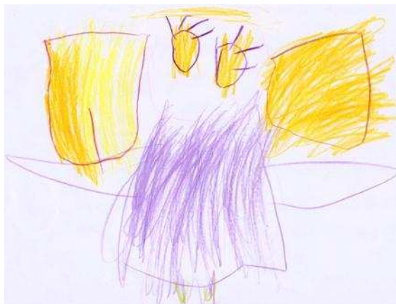
KUVA 5. Alvari-perhetyöntekijä