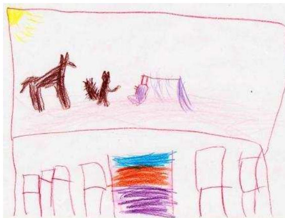
KUVA 1. Muisto retkestä elokuviin Alvari-perhetyöntekijöiden kanssa

Opinnäytetyömme käsiteosiota olemme kuvanneet yleisen teorian lisäksi käsitteisiin liittyvien aiempien tutkimusten avulla. Tutkimukset tarjoavat mahdollisuuden aiheiden kriittiseen tarkasteluun. Tutkimustulokset esittelemme teemoittain ja pohdinnassa keskitymme käsittelemään lapsen näkyvyyttä vanhemmuuden tukemisen varjossa. Olemme huomioineet oman työskentelyprosessin kuvauksessa lapsen osallisuudesta esiin nousseet haasteet.