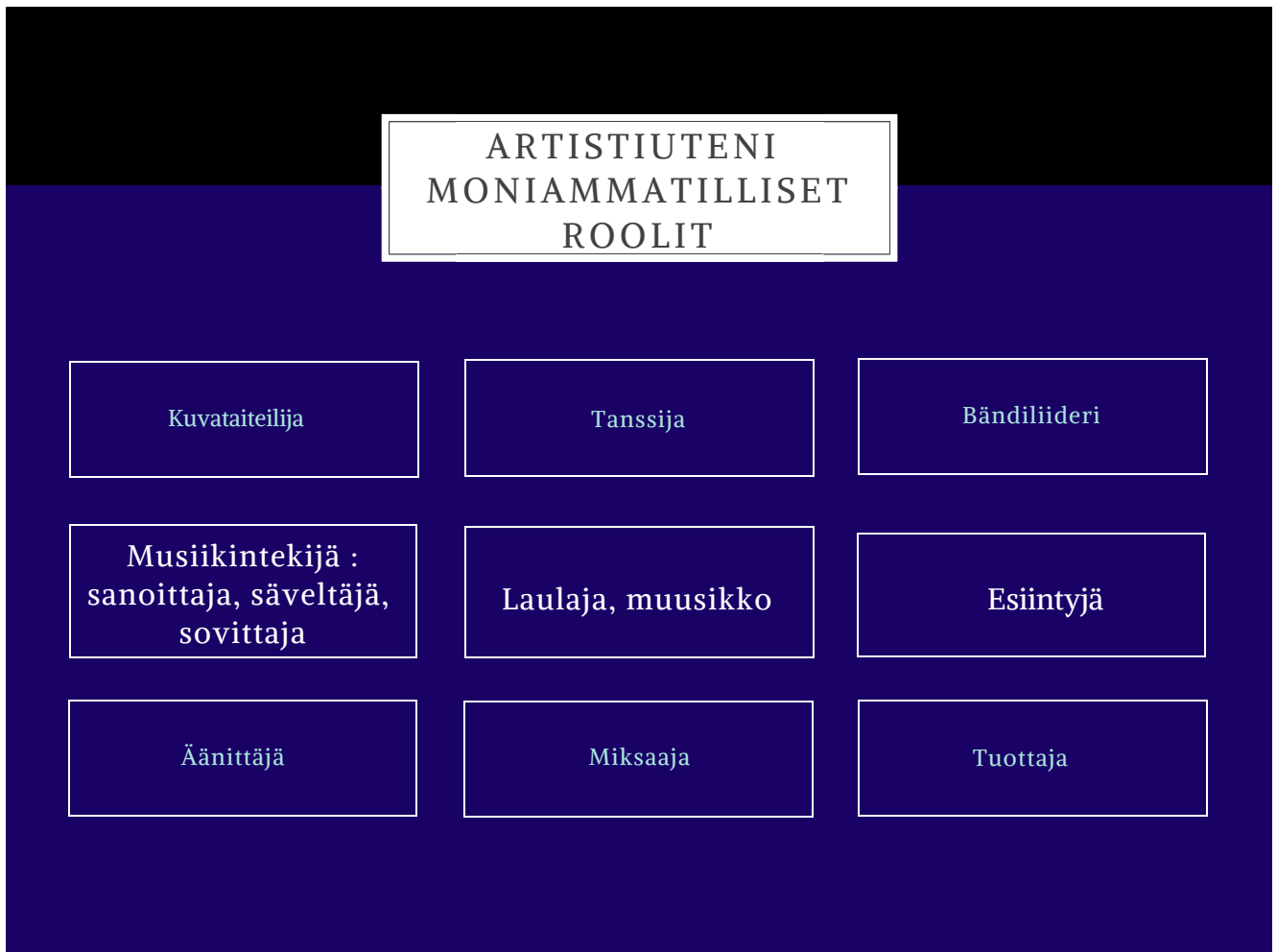
KUVIO 3. Henkilökohtainen artistiuden moniammatillinen työnkuva

vat muuttua ajan myötä vähemmän aktiivisiksi tai nousta aktiivisemmiksi. Näin taiteellinen työskentely pysyy mielekkäänä ja haastavana kautta linjan.