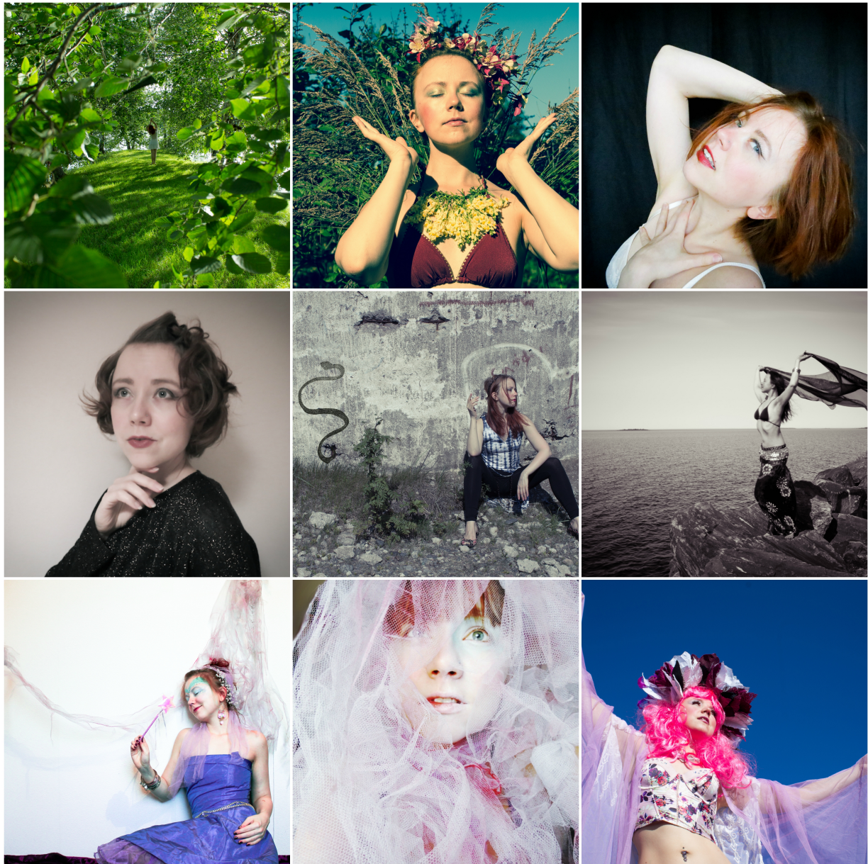
KUVA 2. Kollaasi taidemalli-projekteista

apulaistuottajasta, joka voi vahvistaa artistin omia heikkoja ja sokeita kohtia musiikin tuotantoprosessissa. Luultavimmin pitkäsoiton tekemiseen otan mukaan ainakin taiteellisen tuottajan.