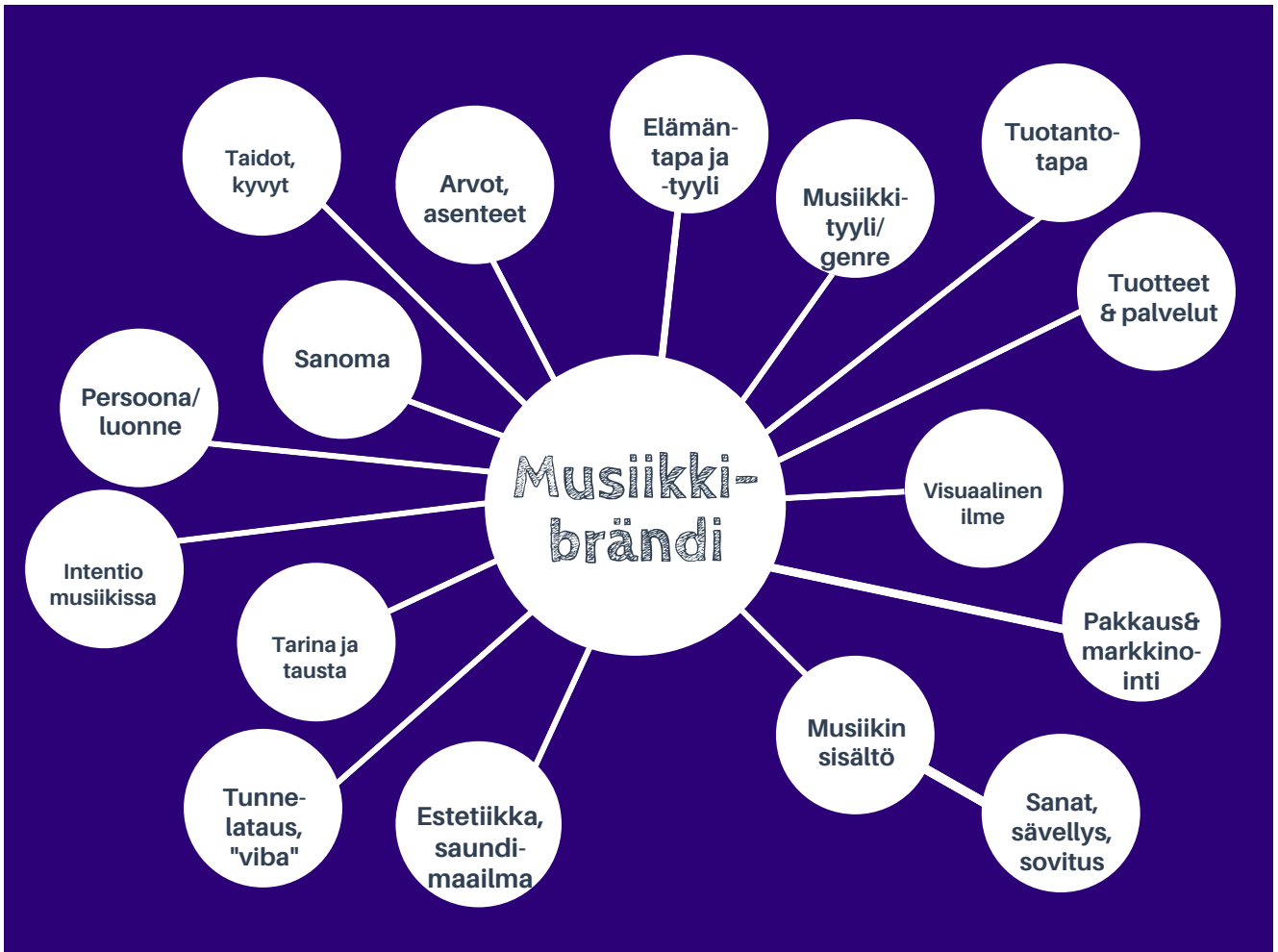
KUVIO 2. Musiikki-brändin eri osia

Brändin ulkoiseen toteutukseen sisältyvät tarjotut tuotteet ja palvelut, taidot, se miten nämä tuotteet pakataan ja markkinoidaan, sekä brändin visuaalisen ilmeen (Black-Barrett 2018). Mitä autenttisempi brändi on, sitä luonnollisempaa artistin on sitä toteuttaa taiteessaan ja markkinoinnissaan, ja yleisön on myös helpompaa tajuta artistin viesti sekä sanoma. Kuluttajat tekevät ostopäätöksiään tunteiden ja mielikuvien pohjalta. Brändillä voidaan erottaa tuote kaikista muista, se voi tarjota kuluttajalle elämyksen tunteen ja arvoa, jota muilla ei ole (Korhonen 2013). Tästä syystä persoonallisuuden korostaminen on muusikolle ja artistille aina etu.