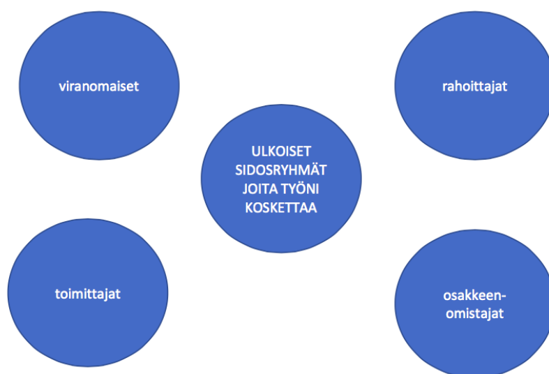
Kuvio 2: Ulkoiset sidosryhmät joita työni koskettaa

Tiimillä on yhteinen päämäärä ja tiimin jäsenet tarjoavat toisilleen päivittäisessä työnteossa oleellista tietoa sekä apua. Se, että jokainen tiimin jäsen tekee työnsä kunnolla, vaikuttaa automaattisesti siihen, että tiimin päämäärät saavutetaan. Muiden tiimien työnteon sujuvuus on riippuvaista siitä, miten minä teen työni ja toisinpäin. Esimerkiksi aikarajoissa työskentely on tärkeää, jotta myös muiden tiimien työskentely sujuu aikataulun mukaan. Laskujen käsittelijät (eli laskujen tarkastajat ja hyväksyjät) haluavat saada itselleen kuuluvat laskun varustettuna oikeilla tiedoilla mahdollisimman nopeasti käsittelyyn itselleen, jotta laskujen käsittely olisi heille mahdollisimman vaivatonta ja että laskut menisivät maksuun ajoissa. Tämän toteutumiseen koko AP-tiimin työskentely vaikuttaa oleellisesti. Esimiehen intresseihin mitä luultavimmin kuuluu se, että hänen vetämänsä tiimi toimii. Ostoreskontran tapahtumat