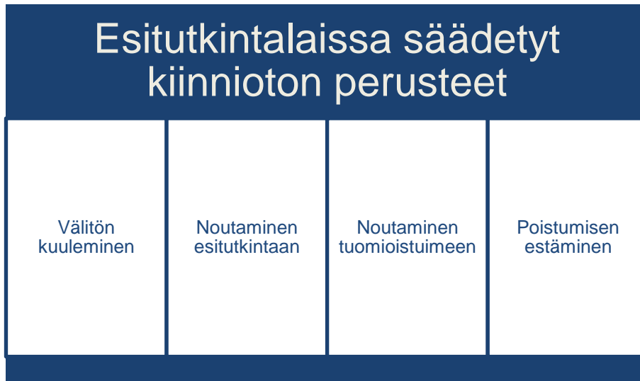
Kuvio 5. Esitutkintalaissa säädetyt kiinnioton perusteet.

Esitutkintalaissa säädettyjä henkilön kiinnioton perusteita ovat välitön kuuleminen, nouto esitutkintaan, nouto tuomioistuimeen ja poistumisen estäminen.