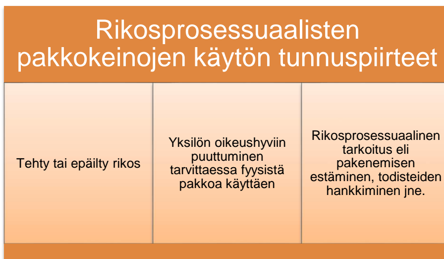
Kuvio 3. Rikosprosessuaalisten pakkokeinojen käytön tunnuspiirteet.

Rikosprosessuaalinen pakkokeino tarkoittaa toimenpidettä, jossa tarpeen mukaan fyysistäkin pakkoa käyttämällä puututaan yksilön lailla suojattuihin oikeushyviin rikosprosessin häiriöttömän kulun turvaamiseksi ja oikean tulokseen saattamiseksi. Rikosprosessuaalisilla pakkokeinoilla on muutama keskeinen tunnuspiirre, joita ovat tehty tai epäilty rikos, yksilön oikeushyviin puuttuminen tilanteen vaatiessa jopa fyysistä pakkoa käyttäen ja rikosprosessuaalinen tarkoitus.