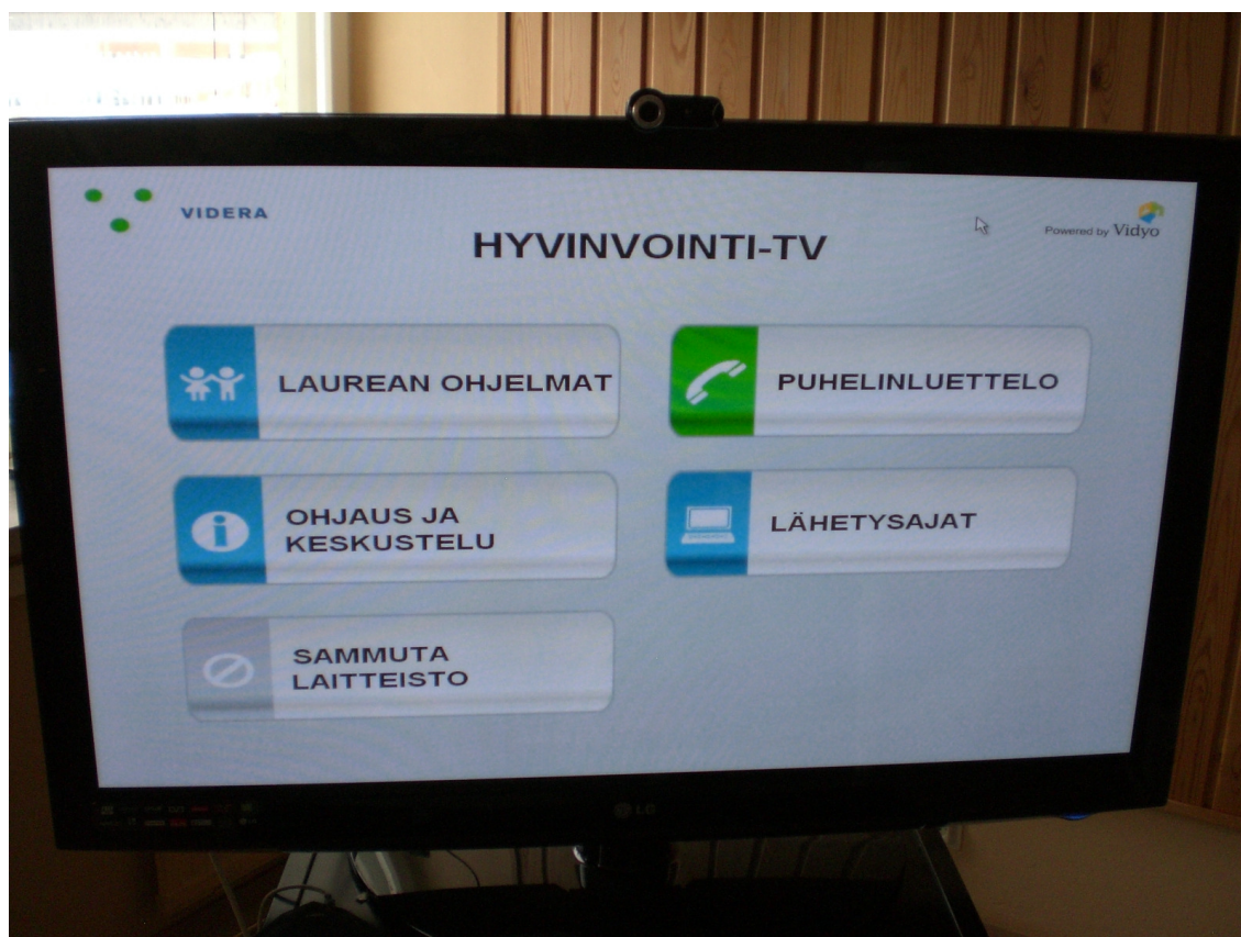
Kuvassa 1 on Hyvinvointi-TV:n aloitusnäkö.

Kuvassa 1 on Hyvinvointi-TV:n aloitusnäkö. Hyvinvointi-TV:n aloitusnäkö on tehty todella helpokäyttöiseksi ja kaikki viisi toiminnallista nappia ovat tarpeeksi isoja, jotta hieman heikkonäköisemmätkin vanhukset pystyisivät ne näkemään. Selkeyden vuoksi jokaisessa napissa on myös kuvake, joka auttaa ymmärtämään mitä kustakin napista tapahtuu (esimerkiksi puhelimen kuva puhelinluettelossa).