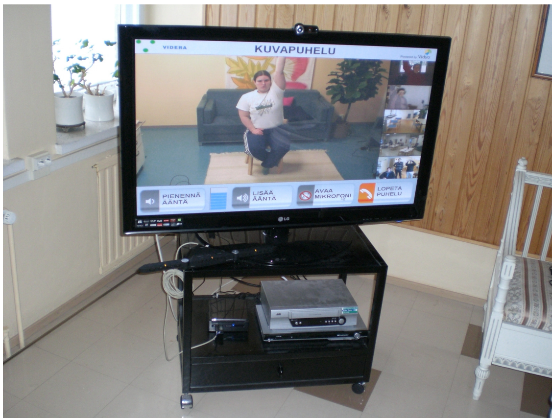
Kuvassa 3 on Sipoon päiväkeskuksen katselutilan Hyvinvointi-TV.

Mikrofoniin puhuvan äänen kuulevat muut samaa lähetystä seuraavat henkilöt. Mikäli mikrofoonia ei olisi käytössä, olisi lähetys vain yksisuuntainen eli toisesta päästä voisi vain kuunnella lähetystä eikä osallistua siihen. Hyvinvointi-TV:ssä on käytössä tällä hetkellä kaksi erilaista mikrofoonia, uudempi ja vanhempi. Liitännänä kummassakin mikrofonissa käytetään USB-liitännää. Alla olevassa uudenmallisessa mikrofonissa on avattavat siivekkeet ja parempi äänenlaatu eli parempi äänen talteenotto.