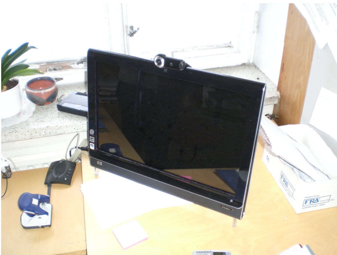
Kuvassa 2 on Sipoon päiväkeskuksen kosketusnäytöllinen Hyvinvointi-TV.

Hyvinvointi-TV:n televisiomalli sopii hyvin isoon tilaan, jossa on paljon katsojia kerralla. Toimintoja ohjataan kaukosäätimellä aivan kuin käytettäisiin tavallista televisiota. Tämä on helppokäyttöisempi versio, koska palvelu toimii tavallisessa televisiossa, jota luultavasti kaikki vanhuksetkin ovat käyttäneet. Televisio-versiossa on isompi kuva, joten sitä on helpompi katsoa. Tässä mallissa ei myöskään tarvitse painella television ruutua valitakseen toimintoja vaan tähän käytetään tuttua kaukosäädintä. Monet vanhukset vierastavat kosketusnäyttöä ja kokevat sen todella hankalaksi ja oudoksi tavaksi käyttää valikkoja ja vanha perinteinen television kaukosäädin tuntuu luontevammalta käyttää.