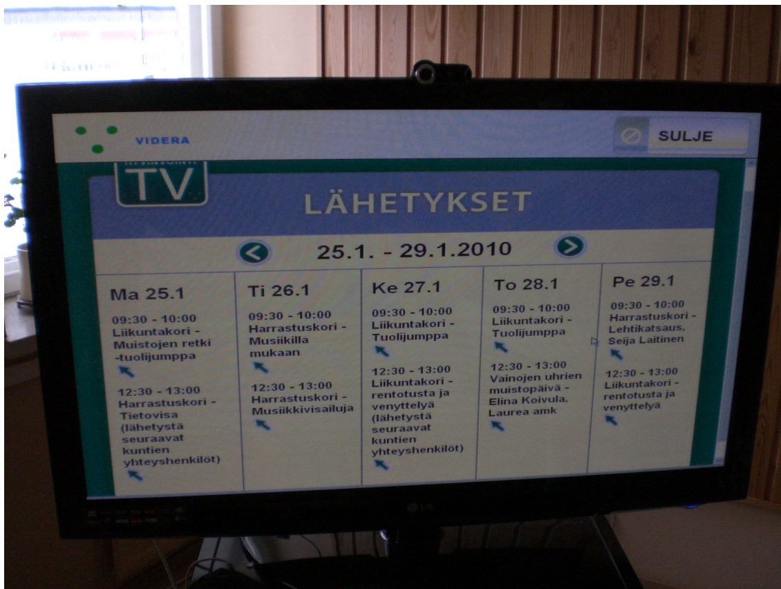
Kuvassa 9 on tyypillinen Hyvinvointi-TV:n yhden viikon ohjelmatarjonta.