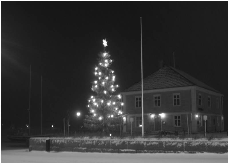
KUVIO 17. Raahen museo joulukuussa 2009

tuoduista tavaroista. Myöhemmin alettiin kerätä kaupunkiin liittyvää esineistöä. (Pussila 2009, 12.)