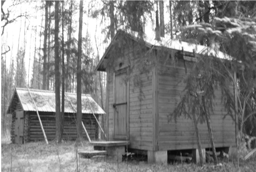
KUVIO 16. Etualalla Pehkosen rakentama mökki ja taaempana näkyvä piharakennus Kultalanperällä joulukuussa 2009

korppuja ja näkkileipää. Kaikki tarvikkeet oli suojattu tai peitelty niin, etteivät hiiret päässeet niitä pilaamaan. (Honka 2009.)