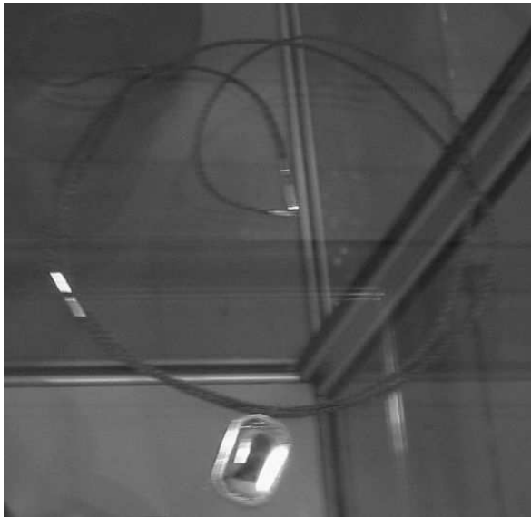
KUVIO 10. Keisarillisen suudelman saaneen lapsen hiuskiehkurasta punottu koru

Keisarin vierailusta jääneet muistot, kuten klaveeri ja keisarillisen suudelman saaneen lapsen hiuskiehkurasta punottu koru ovat nähtävillä Raahen museossa. (Turunen 2001.)