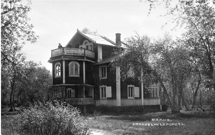
KUVIO 5. Kraaselin lepokoti

Alla olevassa kuviossa on esitetty Kraaselin lepokoti, joka löytyy saarelta vielä tänäkin päivänä. Rakennuksen kunto on hieman heikentynyt aikojen kuluessa. Tämä kuva on otettu 1900-luvun alkupuolella.