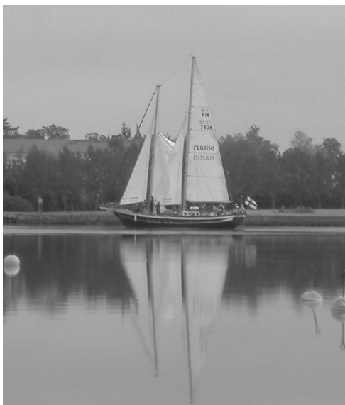
KUVIO 18. Raahen Fiia

Raahen Fiialla vuodesta 1990 tehdyt koululaisten nuorisopurjehdukset ovat olleet opettavaisia ja monet kouluiän ohittaneetkin olisivat kiinnostuneita lähtemään ohjatuille merimatkoille. Fiia purjehduksineen on tuonut Raahelle myös hyvää mainetta ja osoittanut kaupungista löytyvän perinteisiin tukeutuvan matkailuvaltin. Heinäkuussa 2009 Ranta-jazzien aikaan Fiialla järjestettiininkin parin tunnin purjehduksia Raahen saaristoon. Kesällä 2009 saivat halukkaat käydä tutustumassa Fiiaan puolen tunnin ajan keskiviikkoisin. Vieraansa tai yhteistyökumppaninsa voi myös viedä merelliselle retkelle sopimuksen mukaan. Fiiaan tutustuminen sai monia kiinnostuneita liikkeelle, mutta myös muutama sanoi laivan esittelijöiden olleen poissa heidän sinne saapuessaan. Oliko kyse väärinkäsityksestä, esim. vierailuaikojen suhteen, vai oliko esittely järjestetty huonosti, se ei selvinnyt. Fiiaan ja muihinkin aluksiin olisi hyvä saada pidemmät esittelyajat, jotta tavallinen kaupunkilainenkin toisi ulkopaikkakuntalaiset vieraansa sitä katsomaan.