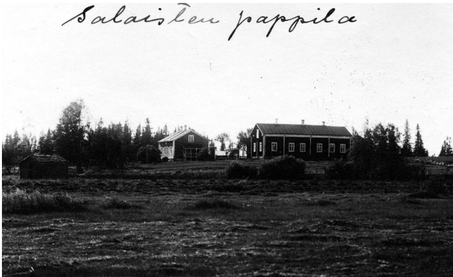
KUVIO 7. Saloisten pappila 1900-luvun alussa

Turusen mukaan Saloisten pappila oli usein matkamiesten käytössä 1800-luvulla. Osa pappilan rakennuksista on 1700- ja osa 1800-luvulta. (Turunen 2009, henkilökohtainen haastattelu 26.11.2009.)