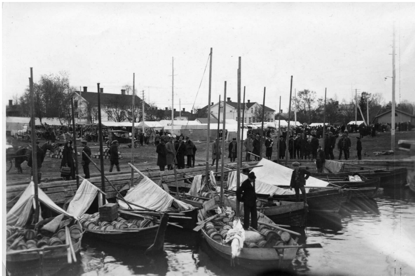
KUVIO 2. Markkinat rantatorilla 1920-luvulla

Isommat markkinat järjestetään rantatorilla nykyään kaksi kertaa vuodessa: syksyllä ja keväällä. Kauppiaita tulee eri puolelta Suomea myymään mm. vaatteita, koreja, hunajaa, karkkia ja leluja. Myös paikalliset leivonnaiset ovat suosiossa. Lisäksi syyskuussa järjestetään Pekkatorilla viljanpäivämarkkinat. Viljanpäivämarkkinoilla osallistujamäärä on paljon pienempi kuin kevät- ja syysmarkkinoilla, jotka järjestetään museon rannassa. Kävijöitä markkinoilla on ilmasta riippuen paljonkin, ja he ovat kaikenikäisiä. Lapaluodon satamassa järjestetään kalamarkkinat vuosittain lokakuussa. Rantatorilla järjestettävillä markkinoille tultiin ennen myös veneillä ja hevoskyydillä, kuten alla olevassa kuvassa näkyy.