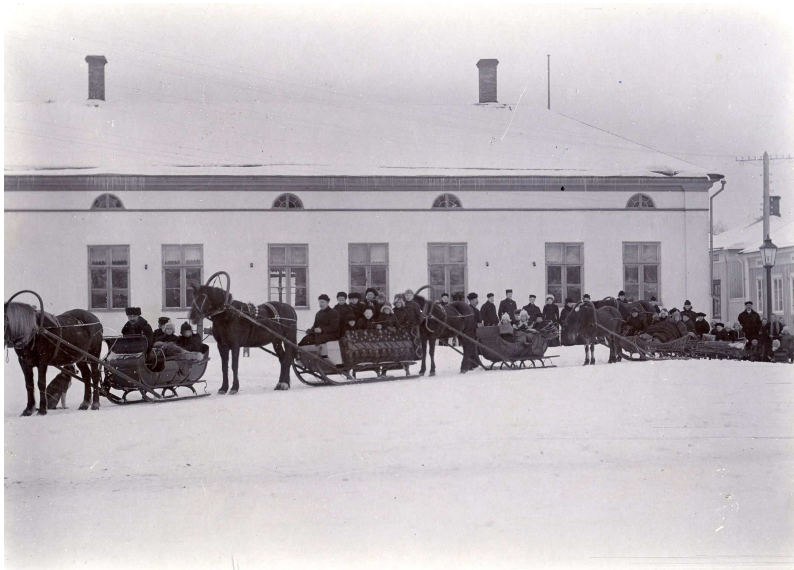
KUVIO 8. Tapaninajelu raahelaisittain

Turunen kertoo myös raahelaisten tehneen virkistysmatkojaan Raahen saaristoon. Alla olevassa kuvassa on meneillään juuri yksi sellainen. Kuva on otettu Fantissa 1900-luvun alku-puolella. (Turunen 2009.)