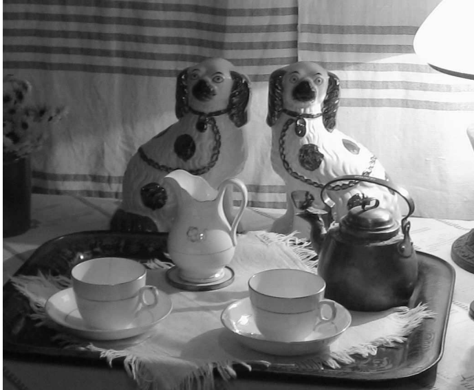
KUVIO 14. Staffordshiren koirat esillä Raahen museossa