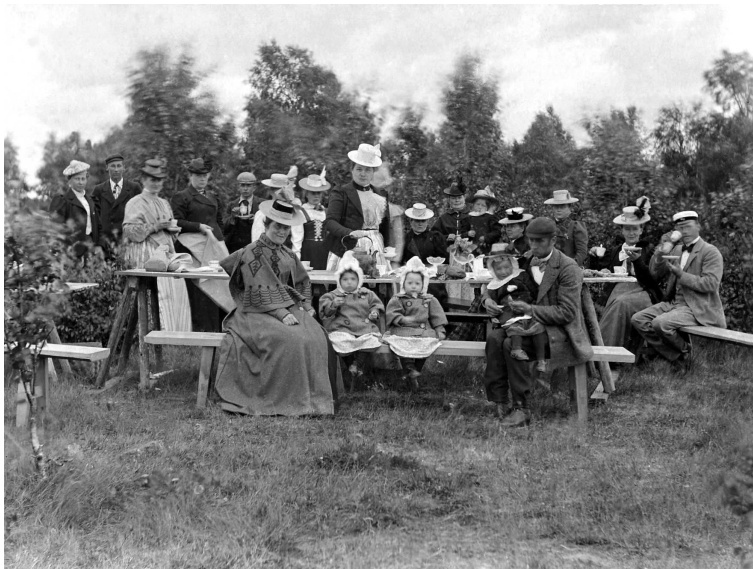
KUVIO 9. Kesäpäivää viettämässä Fantissa

Turunen kertoo myös raahelaisten tehneen virkistysmatkojaan Raahen saaristoon. Alla olevassa kuvassa on meneillään juuri yksi sellainen. Kuva on otettu Fantissa 1900-luvun alku-puolella. (Turunen 2009.)