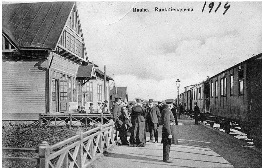
KUVIO 6. Raahen rautatieasema vuonna 1914

Turusen mukaan ihmiset tulivat asemalle katsomaan junan tuloa ja sitä ketä sen kyydistä nousisi. Alla olevan kuvio 6:n naiset ovat pukeutuneet silloisen muodin mukaisesti pitkiin hameisiin. Kuva on otettu vuonna 1914. (Turunen 2009.)