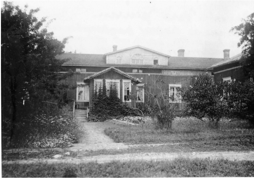
KUVIO 4. Ollinsaaren kartano

Rouva Fredrika Runebergin muistelmista kootussa kirjassa rouva kertoo matkustaneensa vuonna 1820 Raahen Ollinsaari -nimiselle maatilalle enonsa perheen luokse. Rouva oli tuolloin vasta 13-vuotias. Raikas maalaiselämä teki hyvää turkulaiselle kaupunkilaistytölle. Hän kertoi myös nähneensä vierailevan teatteriseurueen esityksiä, jotka olivat suosittuja raahelaisten keskuudessa. (Runeberg 1946, 18–21.)