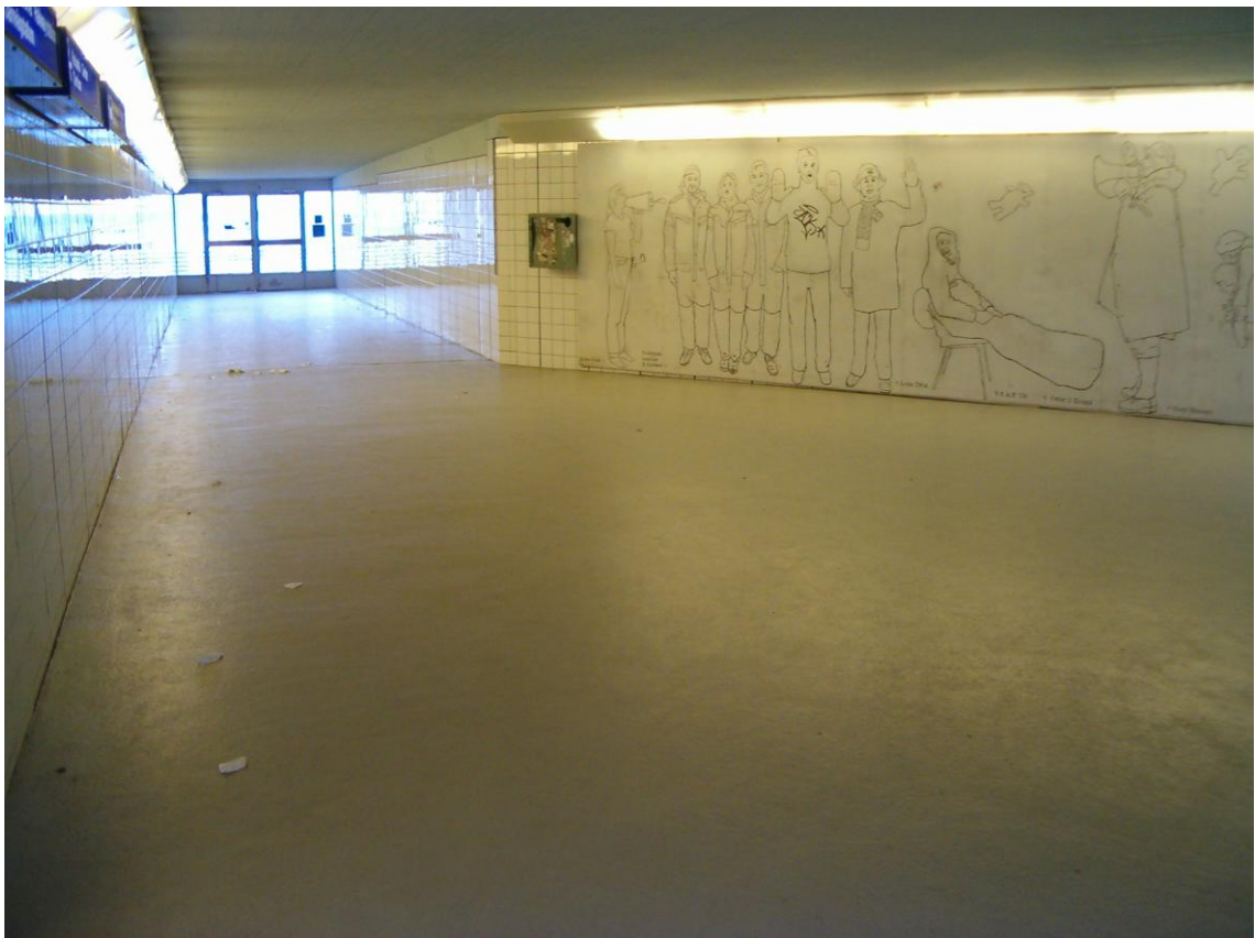
Kuva 2. Asematunneli.

Asematunneli oli tunnelmaltaan epäluonnollinen ja kolkko tila. Se on tehty pääosin betonista, joka tekee tilasta kylmän ja vieraan tuntuisen. Materiaali myös vaikutti tilan akustiikkaan. Jonkun kävellessä tunneli läpi jäivät askeleet kaikumaan ilmaan vielä oven sulkeuduttuakin. Tilassa oli myös hyvin likaista. Tämän pystyi havaitsemaan sekä silmin että haistaen. Tilassa oli paljon pitkiä suorja muotoja ja kaikki oli hyvin kulmi-kasta. Siellä oli hyvin vahva oma maailma. Aistittavissa oli ihmisten toiveita, odotuksia ja unelmia. Tämä johtui ehkä siitä, että tilan läpi kulkee päivän aikana paljon ihmisiä matkustaen jonnekin tai tullen jostain. Itse tila on ja pysyy paikallaan vuodesta toiseen, vaikka ihmiset tulevat ja menevät.