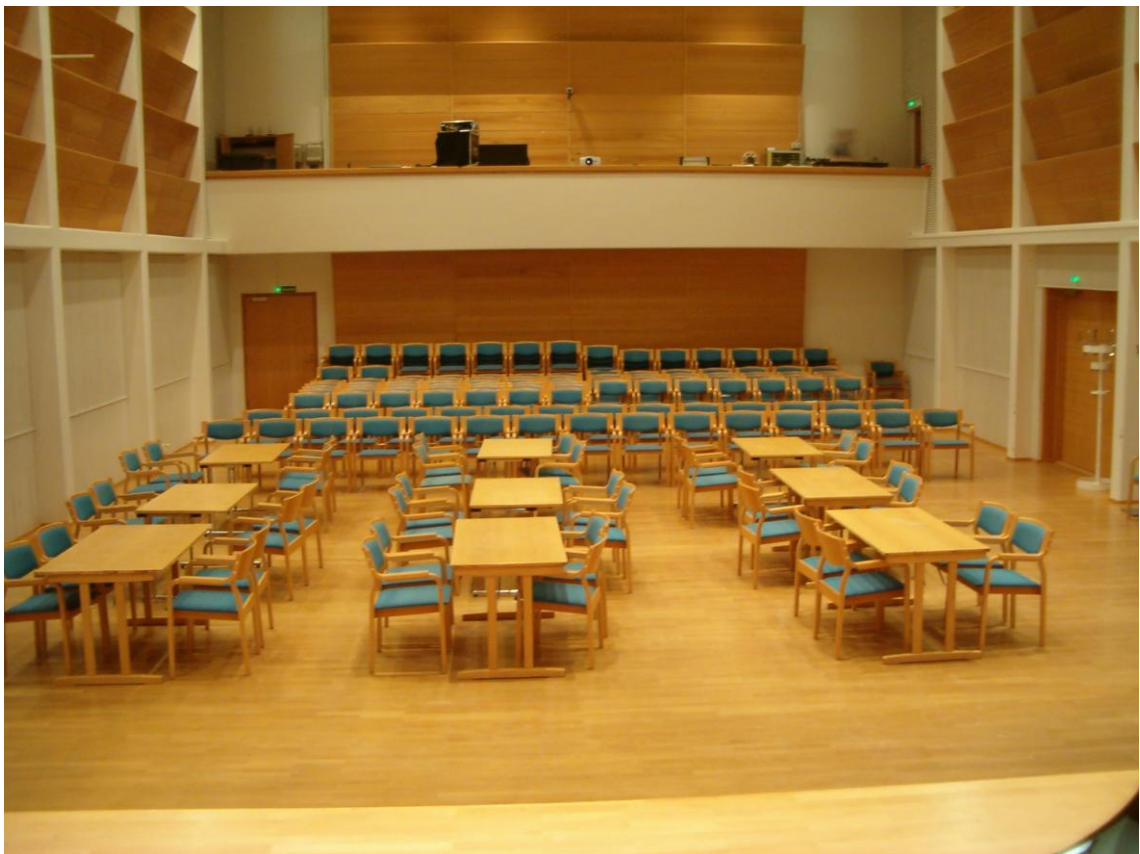
Kuva 3. Kamarimusiikkisali.

Sali oli suorakulmion muotoinen. Toisella pitkällä seinällä oli kaksi ovea ja toinen oli tyhjä. Etuosassa oli pieni nostettu lava. Tilan takaosassa oli ylhäällä tekniikkaa varten pitkä parvi. Tila oli todella korkea ja akustiikaltaan musiikkiesityksiä varten rakennettu tila. Väreinä siellä olivat puun väri ja valkoinen. Tunnelmaltaan paikka oli sellaisenaan aivan kuin kaikki muutkin musiikkiesityksiä varten tehdyt tilat. Siellä aisti esiintymisen ja juhlavuuden tunnun. Musiikki ikään kuin soi siellä kokoajan vaikka kukaan ei soittanut.