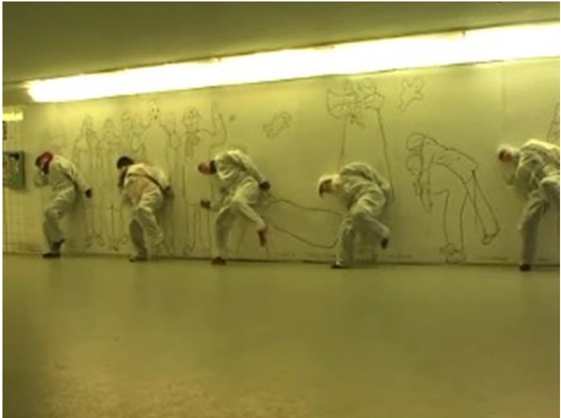
Kuva 4. Seinällä.

Aiemmassa koreografiassani käytin seinää yhtenä elementtinä. Halusin sen myös mukaan tähän teokseen eri tilojen mahdollisuuksien mukaan. Erilaisissa paikoissa seinät ovat rajapintoja ja halusin tuoda ne näkyviin. Toteutimme tämän niin, että jossain kohtauksissa tanssijat tekivät annettua liikesarjaa tai improvisoivat antaen samalla painonsa seinää vasten. Toisin sanoen he nojasivat seinään liikkeessaan.