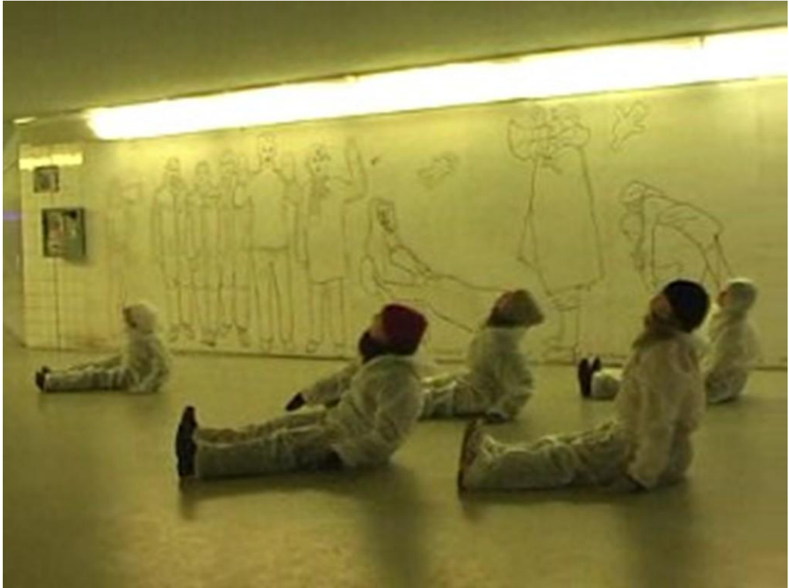
Kuva 5. Esitys asematunnelissa