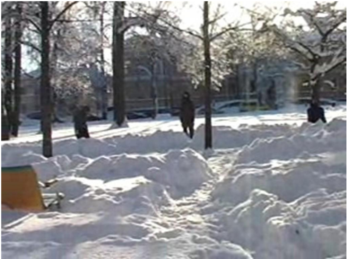
Kuva 1. Piispan puisto.

Puisto oli suorakulmion muotoinen, mutta sen sisällä oli havaittavissa paljon pyöreitä muotoja. Puisto oli jaettu kahteen osaan niin, että sen keskellä kulki leveä aurattu kulkuväylä. Lisäksi paikan molemmissa osioissa kulki pienempiä polkuja muodostaen korkeaan hankeen pienen tieverkoston. Ympärillä oli suuria rakennuksia, kirkko ja kerrostaloja. Ne saivat aikaan vaikutelman pienestä palasesta luontoa luonnottoman kaupunkimaiseman keskellä. Puistoon kantautuva liikenteen melu vahvisti tätä luonnottoman kaupungin vaikutusta ympärillä. Kaiken kaupunkihälinän keskellä puisto oli kuitenkin itsessään kuin rauhan tyyssija. Kaupungin nopean rytmin sisällä oli hidasrytmisempi pieni saari. Verkkaisesti tilan läpi kävelevät ihmiset ja pysähtelevät koiranulkoiluttajat lisäsivät rauhallisuutta, joka tässä paikassa oli aistittavissa. Luonnolla on ominaisuus saada ihmiset pysähtymään hetkeksi, ainakin minut. Tämä ominaisuus näkyi tässä esityspaikassa. Puistossa ollessani kaikki ikään kuin pysähtyi.