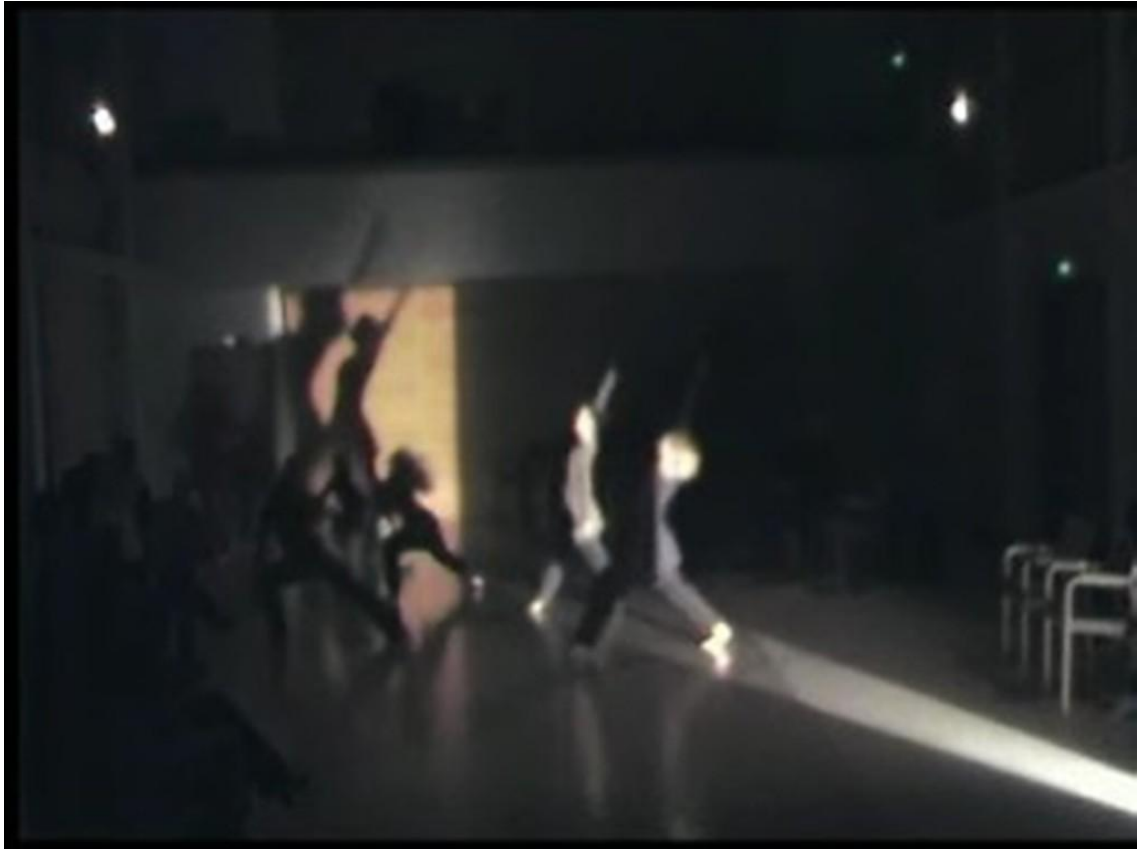
Kuva 6. Esitys kamarimusiikkisalissa