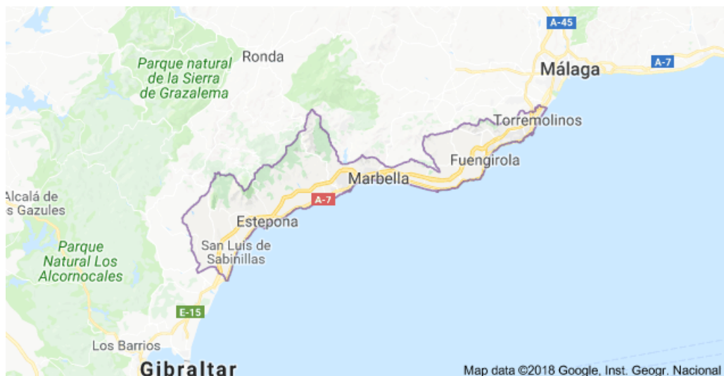
Kuva 1 Aurinkorannikon kartta

Costa del Sol kutsutaan aluetta, joka sijaitsee Espanjassa Andalucian maakunnassa Gibraltarinsalmen ja Gatanniemen välissä Välimeren rannalla (kuva 1 ja 2). Alueen keskellä sijaitseva Malagan kaupunki jakaa Aurinkorannikon itäiseen ja läntiseen osaan. Läntisessä osassa sijaitsevat suomalaisten suosimat kaupungit Fuengirola, Torremolinos ja Marbella. Virallisesti Aurinkorannikon kunnissa asuu yli miljoona henkilöä ja ulkomaalaisten osuus on lähes 300 000. Ulkomaalaisista kaksi kolmasosaa on eurooppalaisia, joista britit ovat yleisimpiä ja heitä on 75 000. (Realista 2018.)