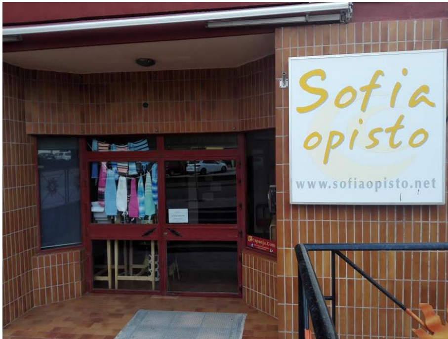
Kuva 5 Sofiaopisto

Myös mediaa pääsee seuraamaan suomenkielellä. Alueella toimitetaan kahta suomalaista ilmaislehteä (Fuengirola.fi ja SE suomalainen Espanjassa) ja Radio Finlandiaa. Suomalaisia ravintoloita ja baareja on alueella lukuisia. Jos kaipaa suomalaisruokaa, niitä löytyy ravintoloiden lounaslietoilta ja suomikauppojen hyllyiltä. Samoin palvelua saa suomeksi lähes joka alalta oli kyse kauneudesta, puhelinliittymästä, terveysasioista tai lakiasioista.