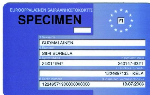
Kuva 3 Eurooppalainen sairaanhoitokortti

Suomessa asuvat henkilöt kuuluvat pääsääntöisesti Suomen sosiaaliturvan piiriin, kunnes he muuttavat pysyvästi pois Suomesta. EU-lainsäädäntö takaa kuitenkin muillekin kuin omille asukkaille tietyt sairaanhoidon ja sosiaalihuollon palvelut. Euroopan parlamentin ja neuvoston 2011 asettama niin kutsuttu potilasdirektiivi selkeytti potilaan oikeuksia terveydenhoitoa vaativissa tilanteissa EU-jäsenvaltioissa. Lähtökohdiana on, että henkilö voi vapaasti hakea korvattavissa olevia terveydenhoitopalveluita muista EU-maista ja kustannuksista vastuussa oleva valtio korvaa ne jälkikäteen kohdemaalle. Terveydenhoitopalveluita toisesta EU-maasta saa Eurooppalaisella sairaanhoitokortilla (Kuva 3). Direktiivin tavoitteena oli myös varmistaa maiden terveydenhoidon laatu ja potilasturvallisuus. (Direktiivi 2011/24/EU; Turunen ym. 2014, 8–9.) Yksityiset vakuutukset mahdollistavat toiseen maahan muuttaneiden suomalaisten pääsyn tarvitsemiinsa palveluihin vakuutusehtojen mukaan ja omavastuun hinnalla.