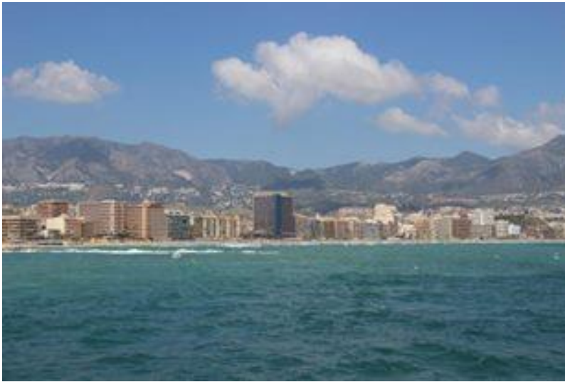
Kuva 2 aurinkorannikko mereltä kuvattuna

Espanja on ollut jo pitkään suomalaisten suosima lomakohde ja Aurinkorannikko tunnettu suomalaisasukkaistaan. Ennen toista maailmansotaa suomalaisten matkustelu ja asettuminen Eurooppaan oli kuitenkin eniten yläluokkaa koskeva asia (Björklund 2008, 9). 1950-luvun lopulla alkoivat suomalaisten seuramatkat Espanjaan, kun Karhumäki oy lennätti ensimmäiset suomalaiset Kanarialle vuonna 1956. Matkojen määrä Espanjaan lisääntyi ja 1959 seuramatkakohteeksi tuli Torremolinos. 60–70 -luvulla alkoi varsinainen massamatkailu lentoliikenteen kehityksen sekä lippujen halventumisen ja elintason nousun myötä. Näin etelän matkailu tuli joukkojen ulottuville ja suosikkikohteeksi nousi Espanja, johon suunnattiin rentoutumaan yhteen kohteeseen kiertomatkailun sijasta. Viimeistään 1972 etelän matkat maallistuivat Kalevi Keihään Keihäsmatkojen myötä. 1980-luvulla matkailu kasvoi ennätysmäärän ja huippuvuodet sijoittuivat 1988–1991. 1990-luvun lamavuosina matkailu vähentyi huomattavasti, kunnes se taas lähti nousuun vuosikymmenen lopussa. (Karisto & Leppälä 2008, 467–468.)