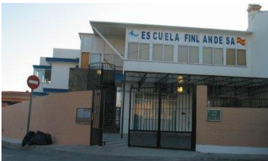
Kuva 4 Aurinkorannikon suomalainen koulu

Fuengirola on suomalaisten näkökulmasta helppo paikka matkustaa ja asua, sillä siellä on mahdollista pärjätä ilman espanjan kielen taitoa ja suuren osan palveluista saa suomeksi. Aurinkorannikon suomalainen koulu (Colegio Finlandés) tarjoaa perusopetusta 1–9-luokkalaisille, esiopetusta ja lukiopetusta myös osavuotisille opiskelijoille, joten perheellisten on mahdollista lähteä koululaisten kanssa tilapäisesti asumaan (kuva 4). Espanjaan. Koulu on niin suosittu, että kaikki halukkaat eivät mahdu sinne ja kevään 2018 haussa noin 200 lasta jäi ulkopuolelle (Piha 2018). Vaihtoehtona tilapäistä peruskoulutasoista opetusta tarvitseville on Fuengirolan kotikoulu.