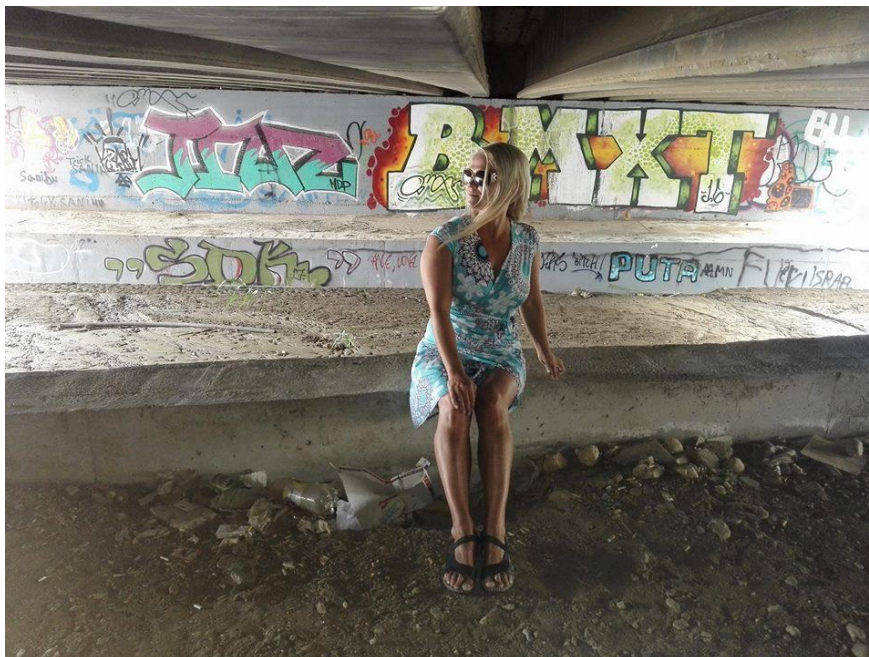
Kuva 7: Sillan alla

nalla, tultiin hakemaan ambulanssilla. Kuulemma täytyi laittaa adrenaliinia, että saivat sen verran eloon, että 4 ihmistä pystyi nostamaan ylös. Yksi nuori soitti juuri kuolleelle läheiselle tekemänsä sävelmän. Oli iloinen, että oli saanut pitää hautajaiset rannassa.