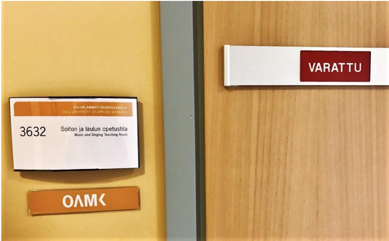
KUVA 3. Harjoittelun tuloksia punnitaan usein luokahuoneessa. Opetustilanne voi olla hyvin intiimi, esimerkiksi opettajan ja oppilaan välinen kahdenkeskinen kohtaaminen

"Silloin ko tietää, että pystyy suoriutuun niistä soitoista paremmin ko omat sektiotoverit tai muuta, niin silloin sitä on aika niinku vahvoilla ja pystyy sitte ottamaan enemmän vastuutaki niissä tilanteissa." (Haastateltava 1)