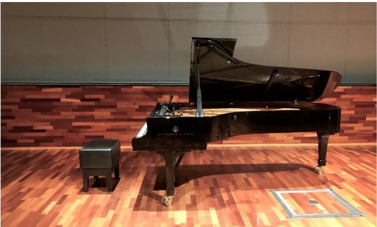
KUVA 4. Estradille halutaan ja siellä soittamista sekä laulamista rakastetaan, jännitetään ja joskus myös pelätään. Esiintyminen voi olla unelmien täyttymys, mutta joskus esiintyjä kokee pettymyksen – kaikki ei mennyt suunnitellusti

» "Sit ku se [opettaja] sano, että tuota hän vois oikeesti kuunnella, siis vaikka niinku kotona levylltäkin. Se oli aika mieletön se tunne. Että siinä vaiheessa tuntu, että nyt on niinku saavuttanu jotain, jonku niinku tason siinä soitossa." (Haastateltava 3)