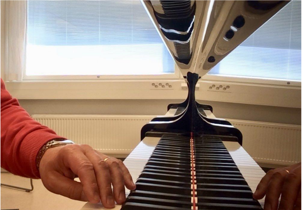
KUVA 2. Suuri osa instrumenttitaitojen harjoittelusta tapahtuu yksin ja suljettujen ovien takana esimerkiksi harjoitustilassa tai kotona