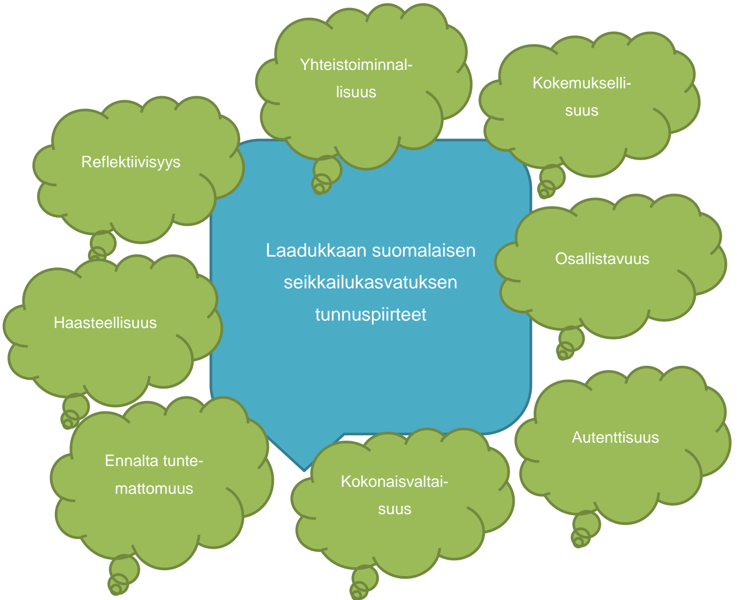
Kuvio 2. Laadukkaan suomalaisen seikkailukasvatuksen tunnuspiirteet S. Wideniuksen (2017) mukaan.