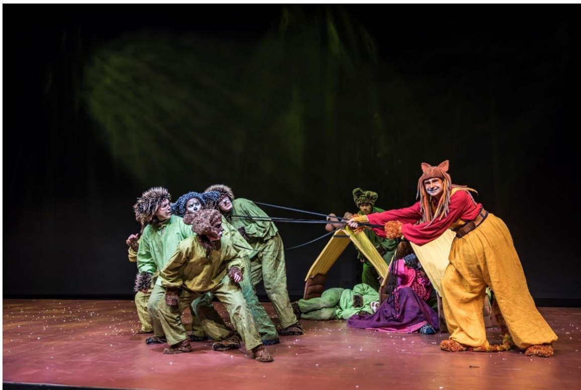
Kuva 3. Koirien Kalevala. Koirat huomaavat jääneensä kiinni Lemminkäisen hihnaan.

Mielestäni ääneni ja tapani ilmaista istuvat parhaiten juuri oopperaan, joten laulutekniset ratkaisut tässä produktiossa tuntuivat luontevalta. Olen opiskellut klassista laulutekniikkaa eniten, joten matala kurkunpää, korkea kitalaki ja aktiiviset poskipäät ovat minulle laulun 'oletusasetukset'. Tytin rooli lepäsi minun äänelläni mukavalla, pääosin kaksiviivaisen oktaavialan sisällä olevalla alueella.