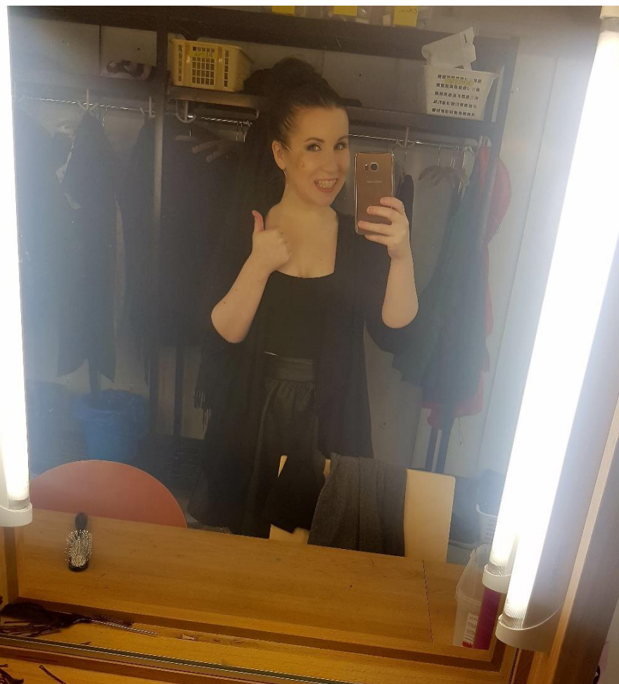
Kuva 4. Hetki ennen Koirien Kalevala -opperan Tytti-roolin laulamista 25.4.2017.