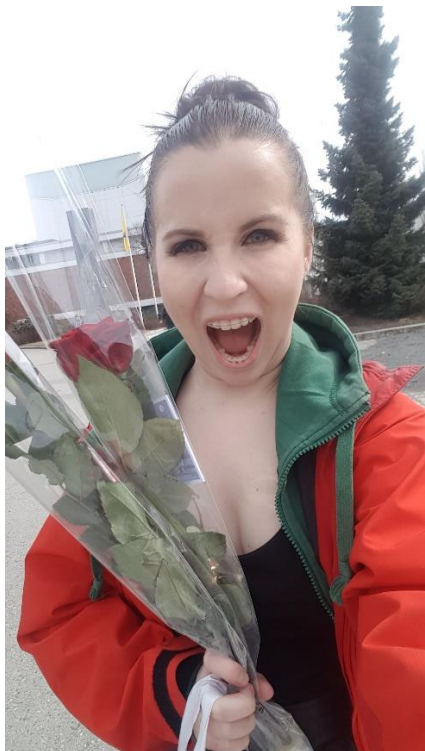
Kuva 7. Tunnelmia onnistuneen pikapaikkauksen jälkeen.

neen käsiään, nyrkkeilleen ilmaa, hyppivän tai laittavan kädet korvilleen ja hengittävän syvään. Näyttämöllä oleminen vaatii syvää keskittymistä ja roolin tunneskaalan elämistä. Itseleni pieni keskittymisrituaali tuntuu auttavan paljon. Keskittyessäni palautan itseni takaisin roolin maailmaan.