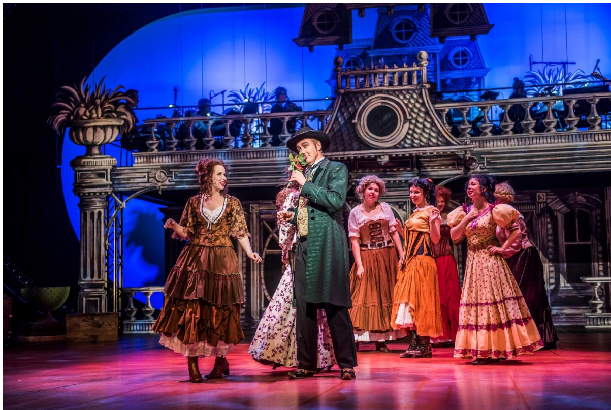
Kuva 1. Annie Mestariampuja -musikaali, Frank Butler ja ihailevat naiset.

Palaute työstä innosti minua jo hyvin alkuvaiheessa. Olen saanut jokaisesta opiskeluaikani palautekeskustelusta paljon hyviä työkaluja jatkoa varten, joten odotin tätäkin palautekeskustelua innolla, etenkin kun en ollut koskaan saanut asiantuntijoiden palautetta näyttämötyöskentelystä tai pikapaikkauksesta.