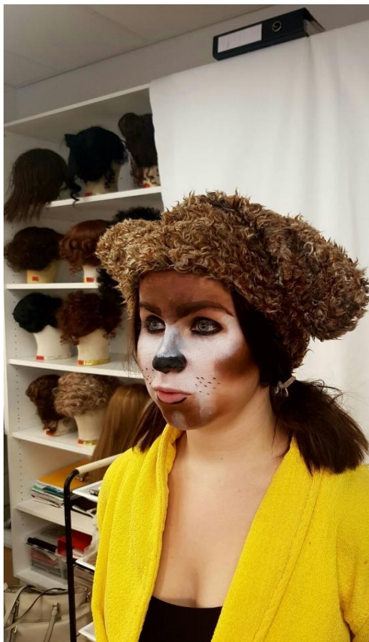
Kuva 2. Koirien Kalevalan koemaskissa.