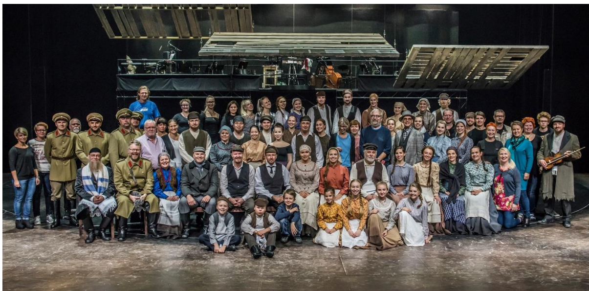
Kuva 5.Osa Viulunsoittaja Katolla -musikaalin työryhmää Kuopion kaupunginteatterissa