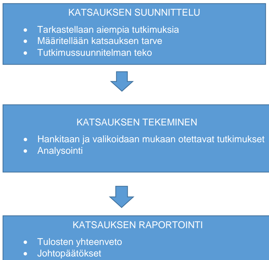
Kuva 4. Systemaattisen kirjallisuuskatsauksen vaiheet (Salminen 2011).

Systemaattisen kirjallisuuskatsauksen avulla tutkittua aihetta voidaan tiivistää, seuloa sekä kartoittaa saaden tulosten kannalta tärkeitä ja mielenkiintoisia näkökulmia aiheeseen. Systemaattisessa kirjallisuuskatsauksessa esitetään tutkitun aihepiirin tutkimuksia tiiviissä muodossa ja samalla voidaan arvioida kyseisten tutkimusten johdonmukaisuutta. Tutkimusmuodon avulla voidaan löytää myös puutteet aiemmista tutkimuksista, sekä löytää uusia tutkimustarpeita. (Salminen 2011, 9.)