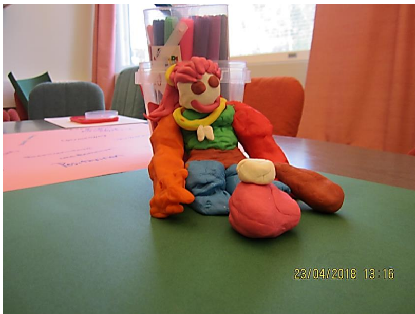
Kuva 1. Luovuuden pöydässä Learning cafessa syntynyt työntekijöiden yhteisöllisenä taideteoksena luoma fiktiivinen ihannetyökaveri, "Heimo" kaikkine supervahvuuksineen.

asioita ja kykenee huolehtimaan asukkaista ammattitaitoisesti ja asukkaan tarpeet yksilöllisesti huomioiden. Hän on huumorintajuinen, empaattinen ja sosiaalinen sekä välittää oman työhyvinvointinsa lisäksi työkavereiden ja asukkaiden hyvinvoinnista. Hän ottaa vastuuta tekemisistään. Hänen päämääränään on asukkaan hyvän elämän, terveyden ja sosiaalisen hyvinvoinnin edistäminen.