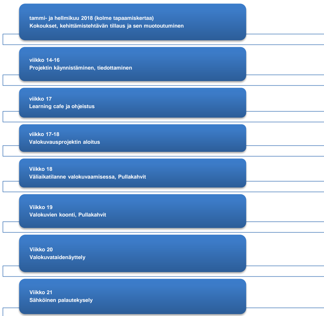
Kuvio 2. Kehittämisyöprojektin aikataulutus (Lindström ja Niiranen 2018)

Alkuun pohdimme työelämäkumppanin kanssa mitä eri vaiheita kehittämistehtävän toteuttamiseen vaaditaan; resurssit, käytännön järjestelyt, ohjeistus, aikataulutus ja tiedottaminen. Laadimme yhdessä alla olevan projektin alustavan aikataulutuksen: