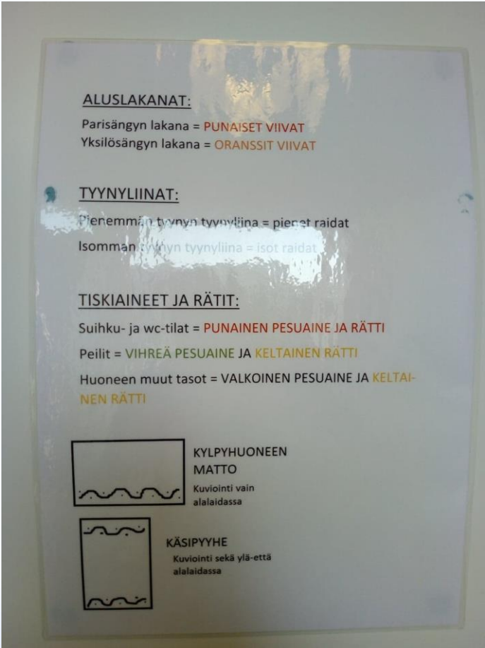
Kuva 1. Kuvallinen ohje, Värikoodit apuna