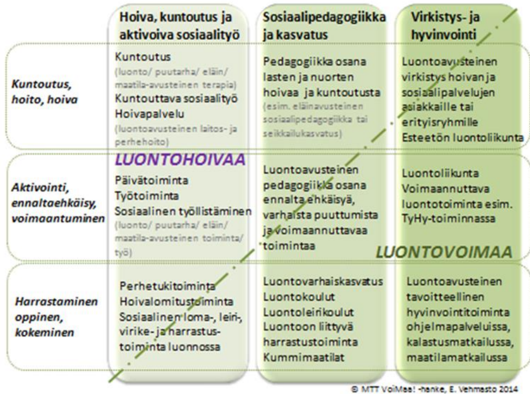
Kuva 2. Green Care -palvelutyypit (Green Care Finland)