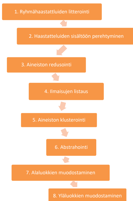
Kuvio 2. Induktiivisen sisällönanalyysin eteneminen (Tuomi ym. 2018, 123–127)

mässä pyritään järjestämään, kuvailemaan ja kvantifioimaan ilmiötä, jota ollaan tutkimassa. Tavoitteena on luoda malleja, jotka kuvaavat ilmiötä tiivistetyssä muodossa. Induktiivisella analyysillä tarkoitetaan yksittäisestä yleiseen liikkuvaa lähestymistapaa, jonka vastakohtana on deduktiivinen yleisestä yksittäiseen liikkuva lähestymistapa. (Kynäs & Vanhanen 1999, 3–5.) Aineistolähtöinen sisällönanalyysi koostuu Tuomen ja Sarajärven (2018, 123–127) mukaan kahdeksasta vaiheesta (Kuvio 2.).