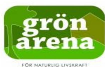
KUVIO 6. Ruotsin Grön arena -merkki (Grön arena gårdar i Värmland, s.a)

Ruotsissa on käytössä Grön arena (=vihreä arena) -merkki maataloilta (kuvio 6.), jonka myöntää Grön arena konsepti. Laatu-merkki on ollut ensin paikallinen projekti Värmlandissa vuonna 2006 ja on levinnyt kansalliseksi Ruotsin alueelle vuonna 2013. Grön arena merkki on hyvin arvokas ja vaalittu työväline Ruotsissa. Sen saamiseksi täytyy käydä koulutus. Tilalle tehdään tarkastuskäynti, jonka perusteella tehdään päätös merkin saamisesta. Tämän jälkeen Grön arena merkin saaneella tilalla tehdään vuosittain tarkastuskäynti toiminnan valvomiseksi. (Nordic green care hanke s.a.)