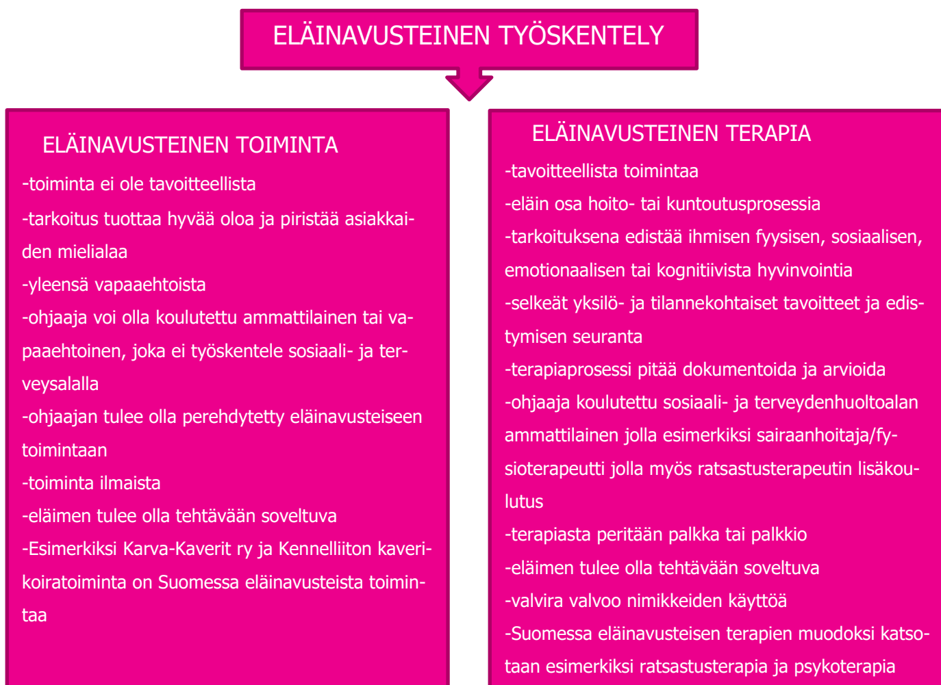
KUVIO 7. Eläinavusteisuuden eri toimintamallit (Ikäheimo 2013, 10-11)

Eläinavusteiseen työskentelyyn liittyy eläinavusteinen toiminta ja eläinavusteinen terapia (kuvio 7.) Eläinavusteisen toiminnan päätarkoitus on tuottaa hyvää oloa ja piristää asiakkaiden mielialaa. Eläinavusteinen toiminta ei sisällä hoidollisia tavoitteita. Se voi olla esimerkiksi kaverikoira- tai luku-koiratoimintaa. Eläinavusteinen terapia on terapiakoulutuksen saaneen ammattihenkilön tuottamaa terapiapalvelua, jossa eläin on keskeisessä osassa. Kyseessä voi olla esimerkiksi toimintaterapia, fysioterapia tai psykoterapia. Suomessa eläinavusteisuudessa käytetään eniten koiraa ja hevosta apuna. (Ikäheimo 2013, 10.)