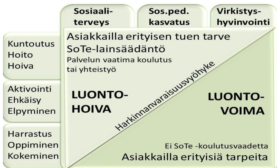
KUVIO 1. Luontohoiva- ja voima. (Green care Finland, s.a)

Luontohoivan palvelut tuotetaan sosiaali- ja terveydenhuollon lainsäädännön alaisuudessa. Se on ammatillista, tavoitteellista terapia- ja kuntoustustyöskentelyä. Se edellyttää asianmukaista sosiaali-, terveys- tai kasvatustieteiden koulutusta kuten sairaanhoitaja, sosionomi, fysioterapeutti tai lähihoitaja. Kuka tahansa ei voi ryhtyä tuottamaan ”luontoterapiaa”. (Suomi ym. 2016, 9.) Luonto- ja eläinavusteisia menetelmiä voidaan käyttää terapian ja kuntoutuksen tarpeisiin. Hoivalaitoksissa ja tuetun asumisen yksiköissä voidaan hyödyntää luonnon tarjoamia mahdollisuuksia asiakkaiden elämänlaadun parantamiseen ja omatoimisuuden tukemiseen. (kuvio 1.)