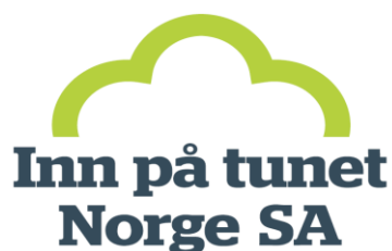
KUVIO 5. Norjan Inn på tunet-logo (Inn På Tunet s.a)

5.) käyttöoikeutta ja tunnustusta haetaan Norjassa maatalouden laatujärjestelmän ja ruuan laadunvalvonta yhdistyksen kautta. (Inn på tunet s.a.)