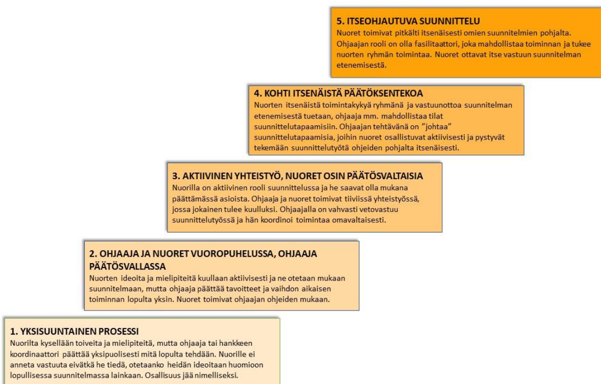
Kuva 3 Osallisuuden portaat nuorten osallisuudesta hankkeen suunnittelussa.

Osallisuuden portaata tarkastellessa tulee ottaa huomioon, ettei aina ole ryhmän edun mukaista tavoitella osallisuuden korkeinta astetta. Nuorten ryhmien osallistumisvalmiudet vaihtelevat suuresti muun muassa iän, koulutuksen ja elämäntilanteiden takia. (Horelli ym. 2007, 217.) Fasilitaattorin onkin hyvä pohtia, minkälainen osallisuus on ryhmässä mahdollista ja tavoiteltavaa.