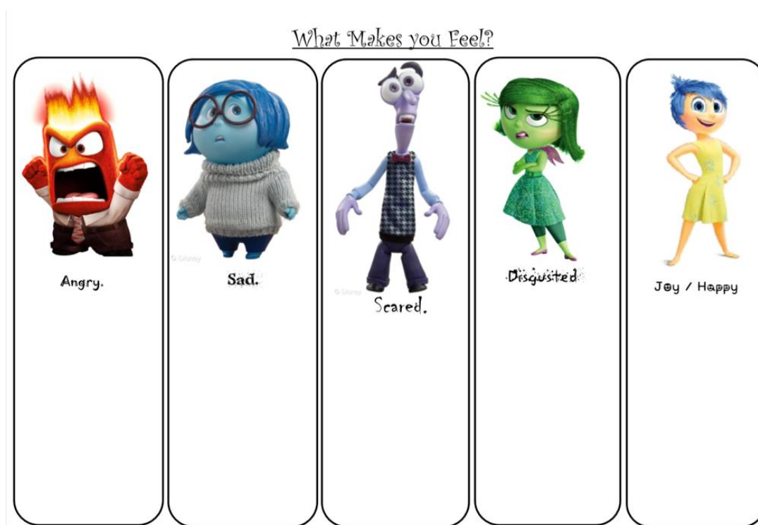
Kuva 3. Tunnetaulukko (Mathematic Shed. Inside Out Feelings.)

samanlaisiin tunteisiin ja yhdistivät niitä, esimerkiksi pelko ja nolostuminen muistuttivat surua. Pelaamisen jälkeen siirryimme täyttämään tunnetaulukkoa (Kuva 3.).