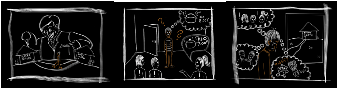
Kuva 2. Sarjakuvan kuvat pienennettynä.

Tämän prosessin perusteella voi miettiä, että missä määrin monimutkaista asiaa voisi pelkistää myös muulle yleisölle. Sininauhaliiton (2014) tuottama Kynnykset sileiksi-teos on hyvä esimerkki julkaisusta, jossa on yhdistetty kirjallista ja kuvallista ilmaisua sarjakuvan keinoin. Myös asumispalveluiden kilpailuttamisesta olisi mahdollista tuottaa julkaisu, jossa esim. sarjakuvia käytetään kirjallisen viestinnän tukena. Kuvat voivat havainnollistaa asiaan liittyviä tunteita, tarinoita tai tilanteita.