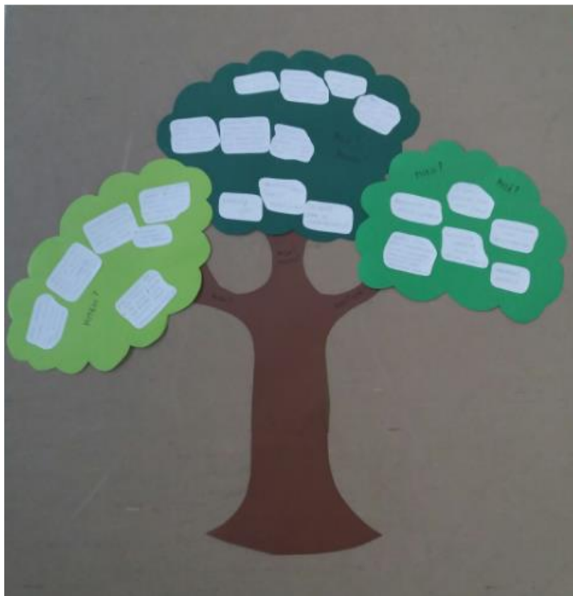
Kuva 2. Liikuntapuu.

Tapaamisten jälkeen papereille kirjatusta ajatuksista koostettiin liikuntapuu (Kuva 2), jonka kasvattajat voivat ripustaa ryhmätilan seinälle muistuttamaan valikoidusta kehittämisideoista ja liikkumisen merkityksestä.