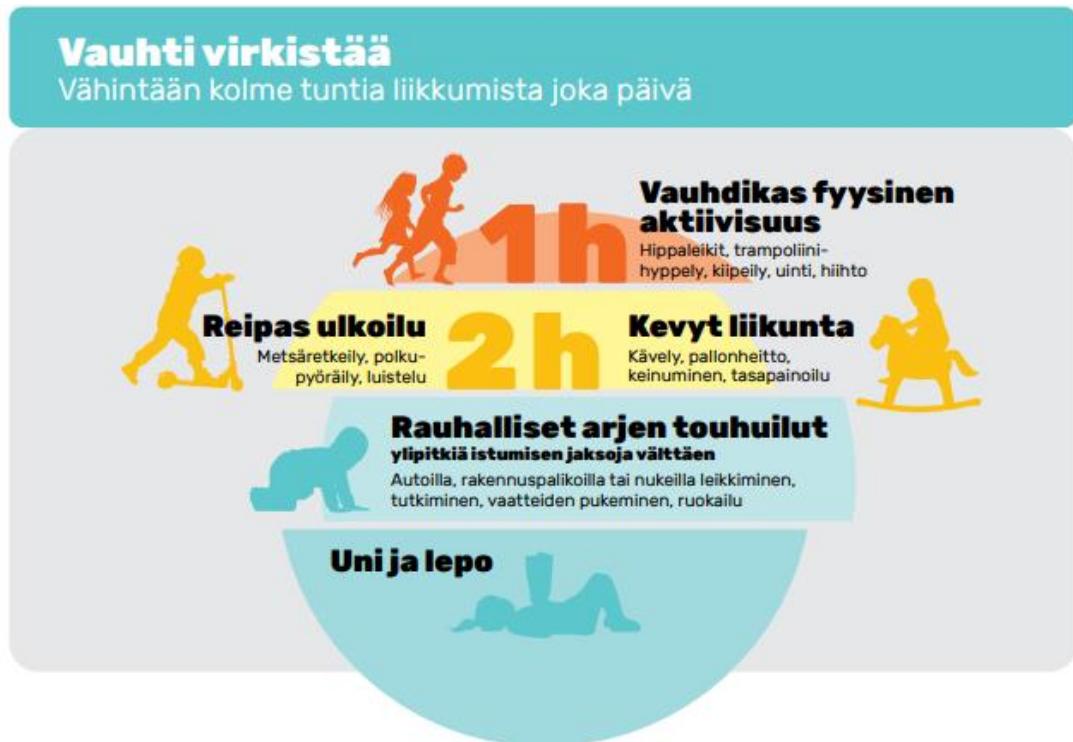
Kuva 1. Kolme tuntia päivässä. Varhaisvuosien fyysisen aktiivisuuden suositukset (2016).

Varhaisvuosien fyysisen aktiivisuuden suosituksissa on huomioitu liikunnan määrän ja laadun lisäksi fyysisen, psyykkisen ja sosiaalisen ympäristön roolit sekä liikuntakasvatuksen ja ohjatun liikunnan suunnittelu ja toteutus varhaiskasvatuksessa (Varhaisvuosien fyysisen aktiivisuuden suositukset 2016).