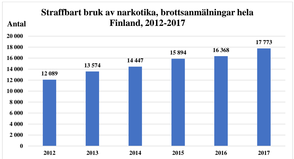
Figur 2. Antalet brottsanmälningar med rubriceringen straffbart bruk av narkotika i hela Finland åren 2012–2017 (Polstat 2018).

I figur 2 beskrivs hur många brottsanmälningar med brottsrubriceringen straffbart bruk av narkotika det har gjorts i polisens register per år under åren 2012 till 2017 i Finland. Av diagrammet kan observeras att det har skett en ständig linjär ökning av mängden brott straffbart bruk av narkotika de senaste fem åren. År 2012 har det rapporterats om totalt 12 089 brott av den typen och fem år senare totalt 17 773. På fem år har ökningen varit 5684. Det här påvisar en ökning med över 1000 varje år, vilket utgör en ökning på tre anmälda straffbara bruk av narkotika dagligen i Finland jämfört med 2012.