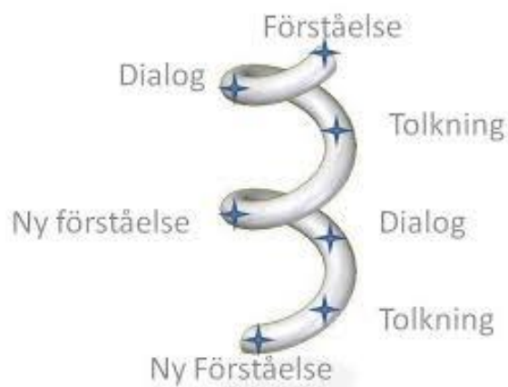
Figur 1. Bild på den hermeneutiska spiralen.

En fenomenografisk undersökning har ofta ett starkt samband med hermeneutik och den hermeneutiska spiralen . I boken Forskningmetodikens grunder (2011) definieras hermeneutik som ett subjektivt förhållningssätt. Hermeneutiken står för kvalitativa förståelse- och tolkningssystem, i vilka forskaren försöker se helheten i forskningsproblemet och använder sig av sin förståelse, sina tankar, känslor samt sina kunskaper. Hermeneutiken kan förklaras med den hermeneutiska spiralen , det vill säga text, tolkning, förståelse, ny textproduktion, ny tolkning och ny förståelse. Allt detta bildar en helhet som växer och utvecklas, vilket demonstreras med hjälp av figur 1.