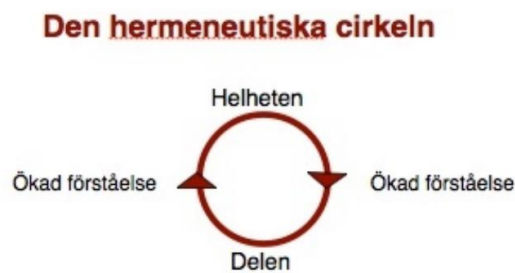
Figur 3. Hermeneutiska cirkeln (Crister Skoglund 2012, s. 2)

Hermeneutik är en typ av tolkningslära som ofta används inom olika forskning. Under 1600- och 1700-talen så använde man sig av hermeneutik när man tolkade bibeltexter. Vidare på 1800-talet så började man även använda sig av hermeneutiken inom humanvetenskapen som en allmän metodologi. Under 1900-talet så blev hermeneutiken en central del inom existentiell filosofi. Inom denna typ av filosofi så menar man att man genom språket kan tolka och förstå den mänskliga existensen medan den moderna hermeneutiken menar att handlingar samt livsytringar och spåren av dessa går att tolka på liknande sätt som texter och språkliga utsagor. I dagsläget är det mest inom samhälls-, kultur- och humanvetenskapen som man tillämpar hermeneutiken. (Patel & Davidson 2011, s. 28.)