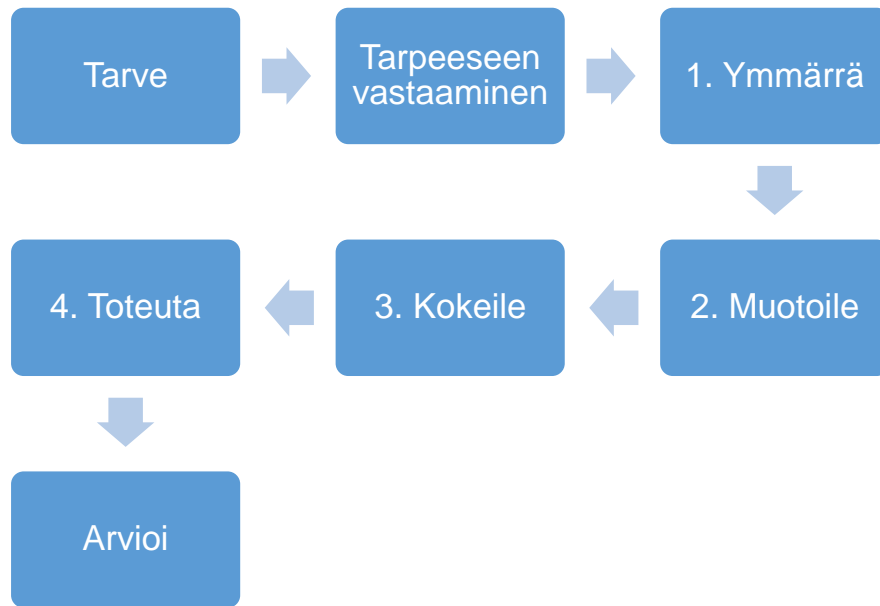
KUVIO 1. Palvelumuotoiluprosessi mukaillen Ahosen (2017, 72) palveluprosessia

Kun havaitaan tarve jollekin uudelle palvelulle, voidaan aloittaa palvelumuotoilu vastatakseen siihen. Ensiksi on muodostettava ymmärrys siitä, mitkä ovat asiakkaan tarpeet ja toiveet sekä palveluntarjoajan tarpeet, tavoitteet, visiot ja rajoitteet. ”Uusimahis”-hankkeessa Zotowin vankka työkokemus vankilatyöstä ja naisvankien kohtaamisesta saatu käsitys työllistymiseen tukevan toiminnan puutteista oli lähtökohtana palvelumuotoilun aloittamiseen. Tässä vaiheessa määritellään mm. päätavoite, visio, hyöty, budjetti, aikataulut, henkilöstöt sekä onnistumisen kriteerit ja mittarit. (Ahonen 2017, 78- 80.) Tätä vaihetta pidetään usein kriittisimpänä vaiheena. Palvelun olisi tarkoitus vastata palvelunkäyttäjien tarpeita ja toiveita, joten tarpeet ja motiivit ovat tärkeä havaita ja tunnistaa. (Tuulaniemi 2011, 142.)