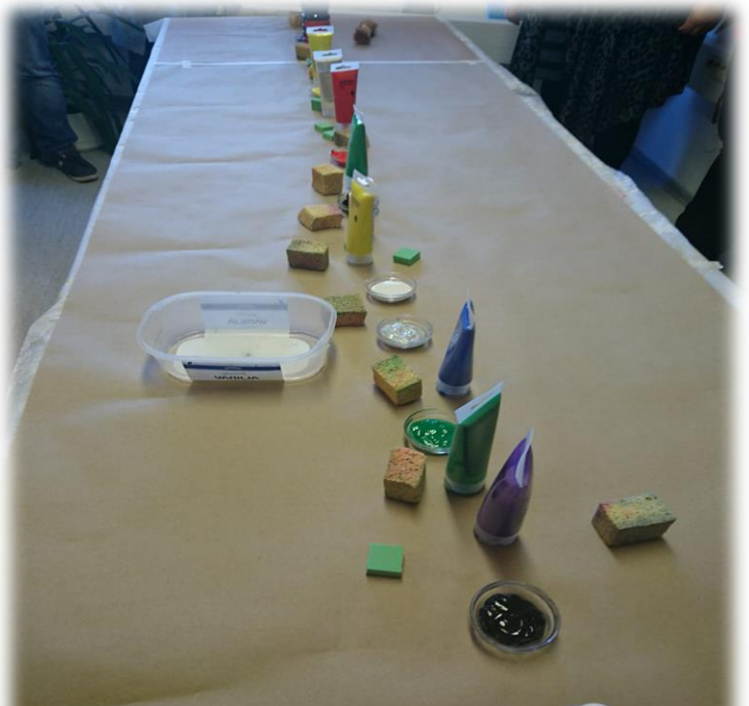
Kuva 2. Valmistelu

Toteutus pyrittiin tekemään osallistujille mahdollisimman helpoksi. Se tehtiin ohjatusti, jotta saatiin paras mahdollinen lopputulos.