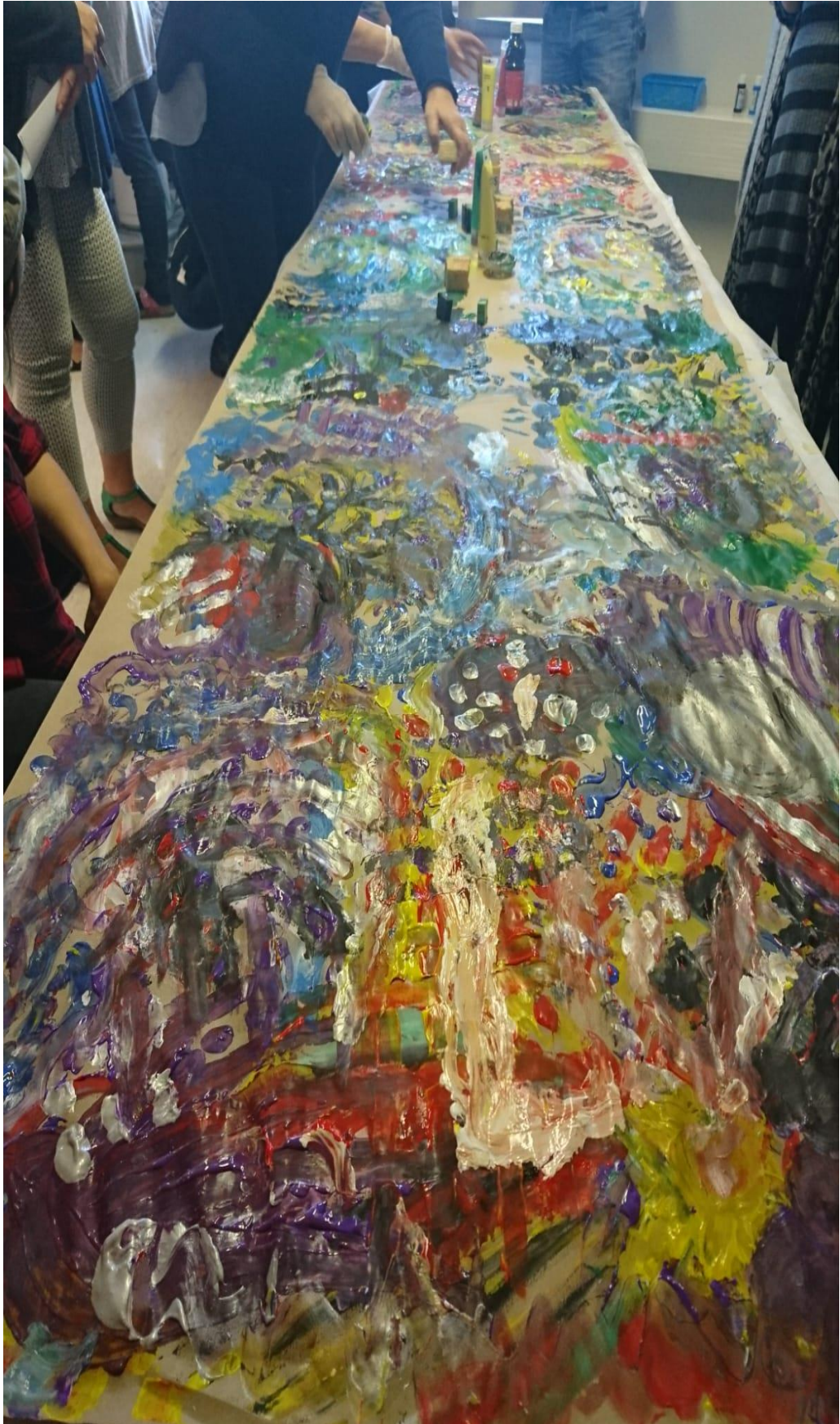
Liite 2. Kuva valmiista maalauksesta