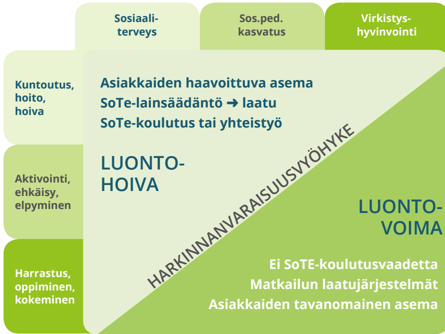
Kuvio 1. Green Care -toiminnan monimuotoisuus ja jakautuminen luontohoiva- ja luontovoimapalveluihin (Vehmasto 2014).

sekä vastuullisuus (Soini ym. 2011). Yhden keskeisen elementin muodostaa myös Green Care -menetelmien käyttö. Ehkä yleisimmin tunnettuja menetelmiä ovat mm. terapeutti- ja sosiaalinen puutarhatoiminta, ratsastusterapia ja eläin- vusteinen toiminta sekä seikkailu- ja ympäristökasvatus. Sopivien menetelmien valinta riippuu palveluiden kohderyhmästä.