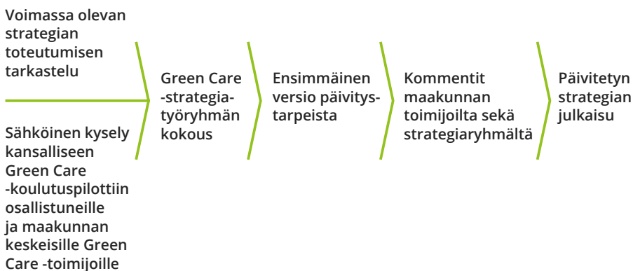
Kuvio 3. Etelä-Pohjanmaan Green Care -strategian päivitysprosessi.

Strategian toteutumisen arviointia ja kyselyiden tuloksia kutsuttiin kommentoimaan ja niiden pohjalta keskustelemaan päivitystarpeista aiemmin nimetty Green Care -koordinaatioryhmä. Ryhmää täydennettiin hieman johtuen vuosien aikana tapahtuneesta henkilöiden vaihtuvuudesta. Keskustelun pohjalta on luotu tämä strategialuonnos, johon on tarjottu mahdollisuus kommentoida laajemminkin. Kommenttien aiheuttamien muokkausten jälkeen luotiin lopullinen strategian päivitysversio (Kuvio 3).