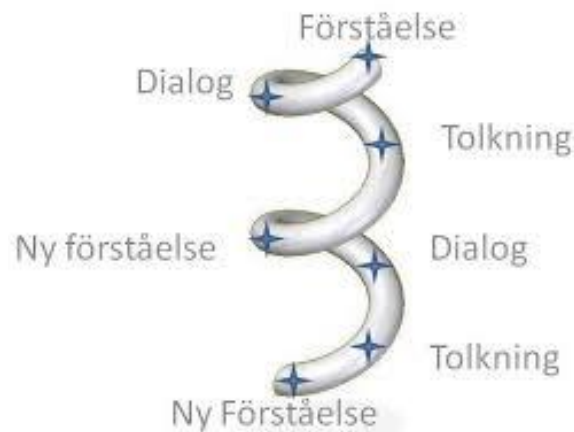
Figur 2. Illustration av den hermeneutiska spiralen (Jordan, 2016).

Inom hermeneutiken finns det ingen bestämd utgångspunkt eller slutpunkt. Man pendlar mellan helhet och del, mellan forskaren och objektet, mellan förståelse och ny förståelse, vilket resulterar i ökat perspektiv och en helhet som utvecklas. Detta kallas för den hermeneutiska spiralen . I figur 2 kan man se en illustration av den hermeneutiska spiralen. (Patel, Davidson, 2011, s. 28–30.)