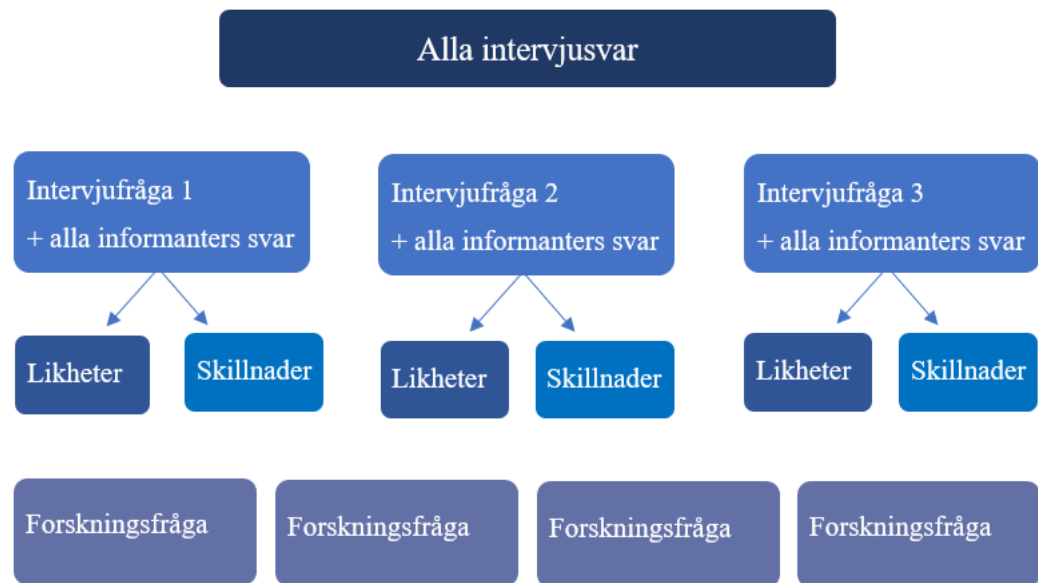
Figur 3. Illustration av analysprocessen av det insamlade intervjumaterialet.

Under intervjuerna frågade jag samtliga informanter vad de använt för narkotika samt hur ofta. Samtliga informanter har missbrukat cannabis, amfetamin och narkotikaklassade läkemedel. Annan narkotika som använts är bl.a. ecstasy, kokain, subutex och heroin. Samtliga informanter använde narkotika dagligen.