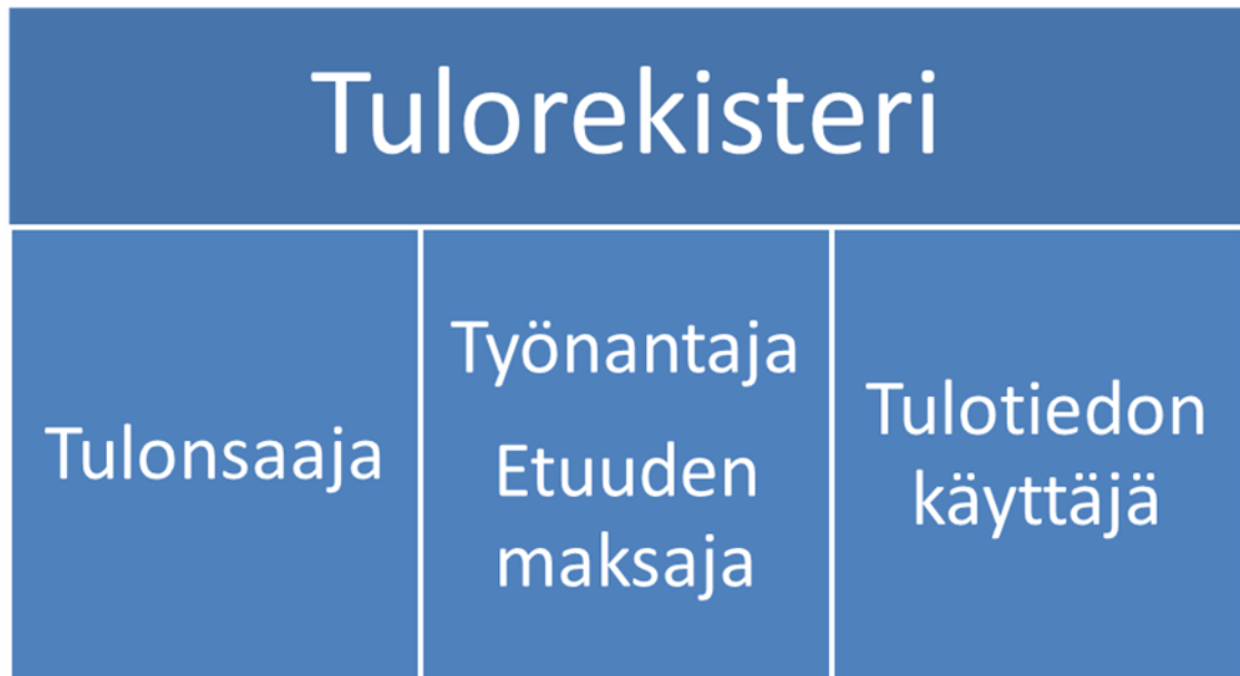
Kuvio 1. Keitä kansallinen tulorekisteri koskee.