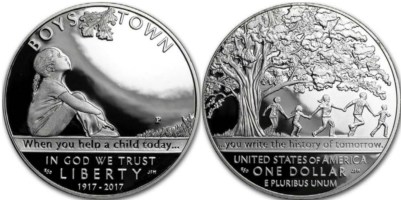
Kuva 2. Hopeinen 1 dollari UNC, ennakkohinta $46,95, normaalihinta $51,95 sekä PROOF, ennakkohinta $47,95, normaalihinta $52,95. Maksimipainos yht. 350 000 kpl, toteutunut painos UNC 12 313 kpl / PROOF 26 119 kpl.