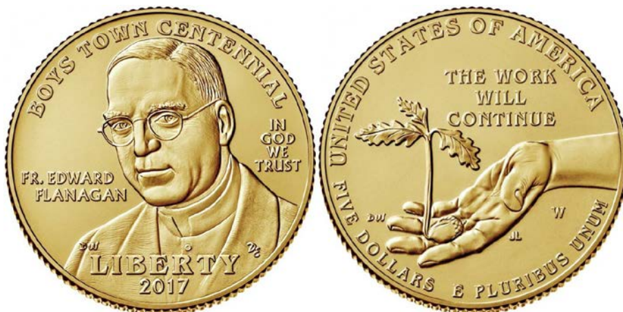
Kuva 3. Kultainen 5 dollaria UNC, normaalihinta $400,45 sekä PROOF, normaalihinta $404,45. Maksimipainos yht. 50 000 kpl, toteutunut painos UNC 2 947 kpl / PROOF 1 844 kpl yksittäin + 5 532 kpl triplaseteissä = 7 376 kpl.