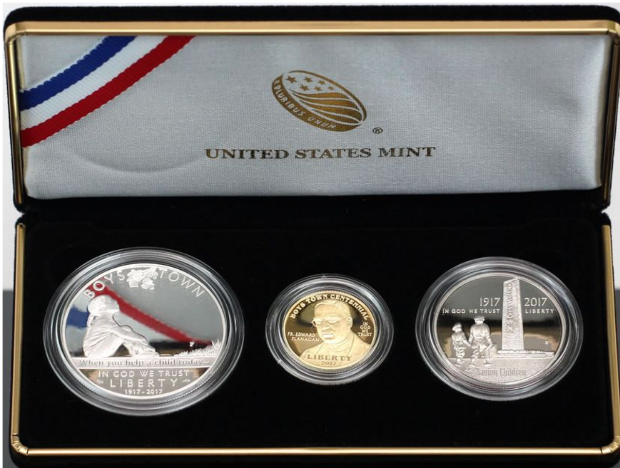
Kuva 4. Triplasetti \frac{1}{2} , $1 ja $5 PROOF normaalihinta $466,45. Toteutunut myynti 5 532 kpl.

5 dollarin kultarahojen hinnoittelu perustuu portaittaiseen kullan markkinahintaan perustuvaan hintataulukkaan, jossa esimerkin hinnat perustuvat kullan hintahaarukkaan 1200,00 – 1249,99 $/troy-unssi. Hintahaarukassa 1150,00 – 1199,99 $/troy-unssi olisivat kultarahojen hinnat $388,30 / $393,30, hintahaarukassa 1250,00 – 1299,99 $/troy-unssi olisivat kultarahojen hinnat $412,60 / $417,60 ja nykyisessä hintahaarukassa 1300,00 – 1349,99 $/troy-unssi (18.1. 2018 1330 $) olisivat kultarahojen hinnat $424,75 / $429,75. Hintataulukot löytyvät sivulta https://catalog.usmint.gov/on/demandware.static/-/Sites-usm-site-catalog-us/default/dw094eed1e/images/PDFs/2016-Pricing-Grid-Numismatic-Gold-and-Platinum.pdf .