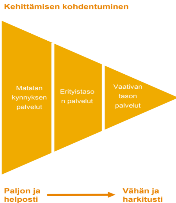
Kuva 1. Kehittämisen kohdentuminen. (Riikonen 2017).

osalta matalan kynnyksen palvelut ovat halvempia, kuin vaativan tason palvelut. (Riikonen 2017.)