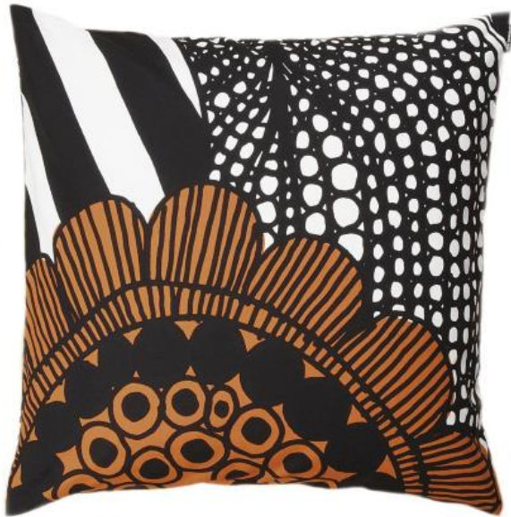
Marimekko Siirtolapuutarha sisustustyyny

-Alvar Aallon kalusteet ovat täyttä puuta/luonnonmateriaaleja, joten nekin ovat allergiaystävällistä materiaalia.