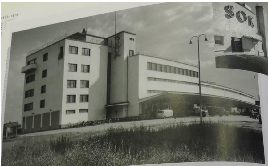
Kuva 4. Oulun konttori.

SOK käytti funkistyyliä myös pienempien myymälöiden rakentamiseen maaseuduille 1930-luvun alussa. Niistä suunniteltiin tasakattoisia, rapattuja ja valkoisia myymälöitä ja niitä rakennettiin paljon ympäri Suomen. Näitä myymälöitä alettiin kutsua ”Huttusen laatikoiksi”. Aluksi tyylisuuntaa maaseudulla vieroksuttiin ja kyseenalaistettiin, mutta ajan kanssa niihin totuttiin ja ne lopulta myös hyväksyttiin. Alla olevassa kuvassa 5 on Keski-Pohjanmaan osuuskaupan myymälä Kokkolasta. Se on Erkki Huttusen suunnittelema sivumyymälä. (Herranen 2004.)