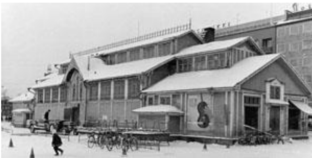
Kuva 7. Joensuun torin kauppahalli (KuMa 2003.)

Myös kaupungintalo ja lyseo on rakennettu torin laidalle. 1960-luvulle saakka torin kuvaan kuuluivat myös vossikat, taksit ja linja-autot, sillä se oli niiden oma keskuspaikka. Torin tärkein rakennus, kauppahalli rakennettiin torille 1900-luvun alussa. Syynä kauppahallin perustamiselle oli elintarvikehygienian seuraaminen, eli lihaa, kalaa eikä muitakaan elintarvikkeita ei saanut myydä enää torilla. Elintarvikkeiden lämpötiloja ei seurattu ja ne pääsivät helposti pölyttymään. Myös markkinoiden tunnelma alkoi käydä vuosien varrella liian villiksi, mistä syystä kauppahalli päätettiin rakentaa. (Pohjois-Karjalan museo Hilma 2018.)