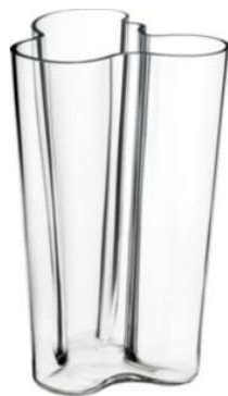
Iittalan Aalto maljakko.

Alvar Aallon mallistosta löytyy myös maljakkoja, mm. Iittalan Aalto maljakko