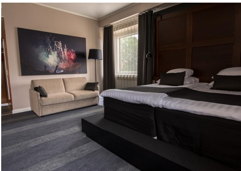
Kuva 2. Ilosaarirock -teemahuone.