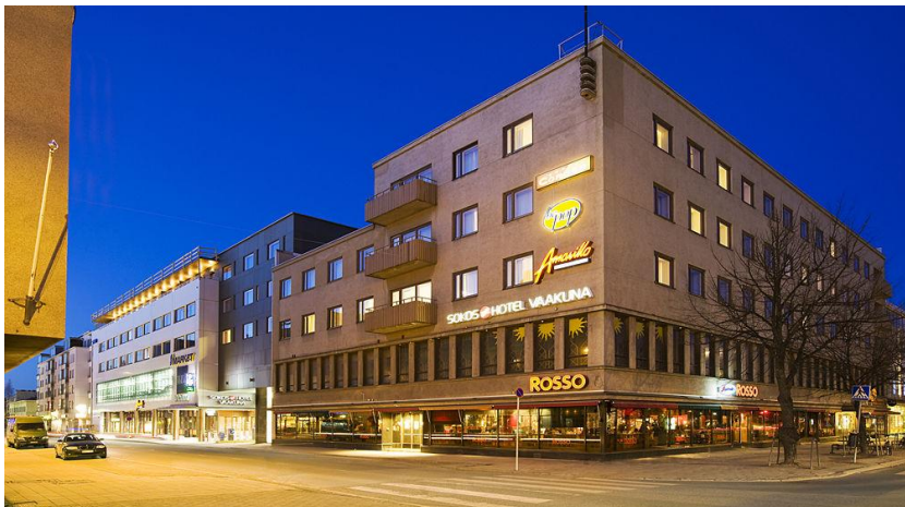
Kuva 1. Original Sokos Hotel Vaakuna Joensuu (Sokoshotels.fi 2018).