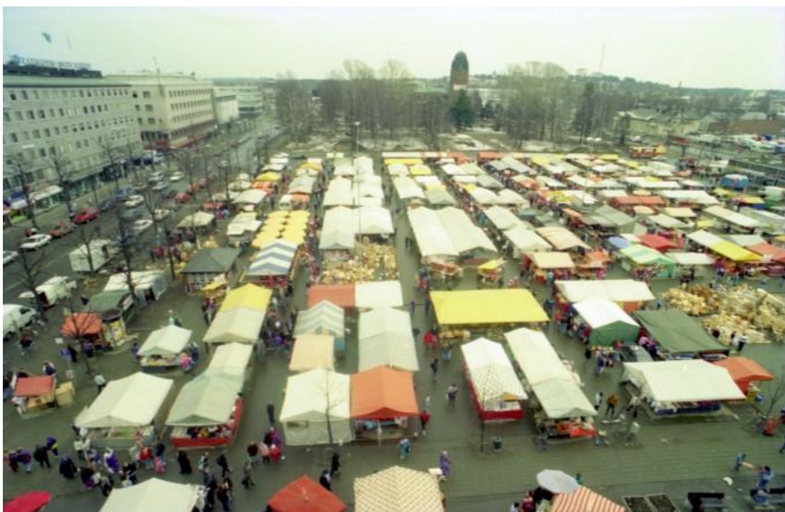
Kuva 6. Vuoden 1994 huhtimarkkinat Joensuun torilla (Siippainen 2018.)

Joensuun torilla on vuosien aikana järjestetty monenlaisia tapahtumia, muun muassa mielenosoituksia, joulunavauksia, konsertteja sekä rallikisoja. Neljä kertaa vuodessa torilla järjestetään myös markkinat.