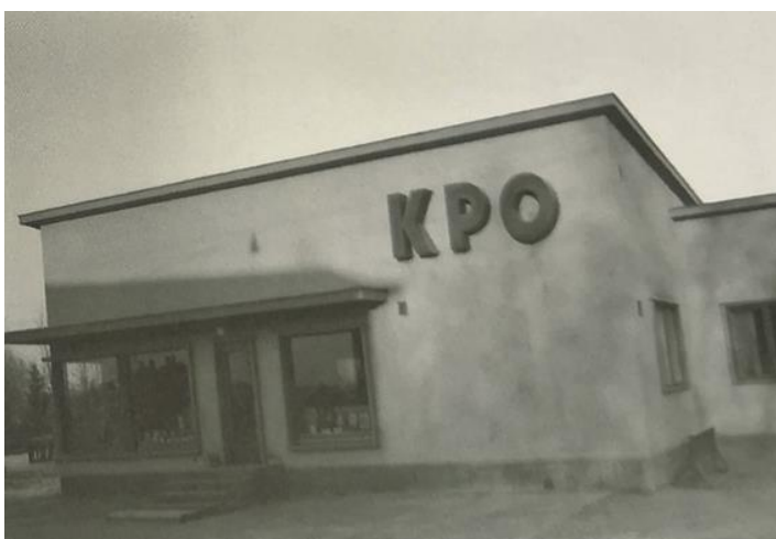
Kuva 5. Osuuskaupan myymälä. (Kuva Yhdessä eteenpäin 2004).

SOK käytti funkistyyliä myös pienempien myymälöiden rakentamiseen maaseuduille 1930-luvun alussa. Niistä suunniteltiin tasakattoisia, rapattuja ja valkoisia myymälöitä ja niitä rakennettiin paljon ympäri Suomen. Näitä myymälöitä alettiin kutsua ”Huttusen laatikoiksi”. Aluksi tyylisuuntaa maaseudulla vieroksuttiin ja kyseenalaistettiin, mutta ajan kanssa niihin totuttiin ja ne lopulta myös hyväksyttiin. Alla olevassa kuvassa 5 on Keski-Pohjanmaan osuuskaupan myymälä Kokkolasta. Se on Erkki Huttusen suunnittelema sivumyymälä. (Herranen 2004.)