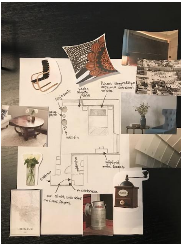
Kuva piirretystä pohjapiirustuksesta.

Sisustuslamput luovat mukavasti tunnelmaa tilaan. Pienempien valaisimien ja sisustuslamppujen sijoittaminen huoneessa täytyy suunnitella niin, että asiakas pystyy työskentelemään tai lukemaan kaikkialla huoneessa. Yö valon sijainti voi olla joko seinään kiinnitettynä tai yöpöydällä. Sen tulee sijaita niin, että sen voi sammuttaa ja laittaa päälle ilman, että tarvitsee nousta sängystä. (Rautiainen & Siiskonen 2005, 60.)