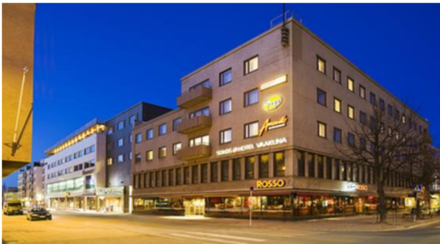
TORITEEMAHUONEEN SISUSTUSSUUNNITELMA ORIGINAL SOKOS HOTEL VAAKUNA JOENSUULLE