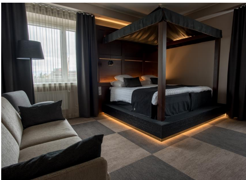
Kuva 3. Omar Sharif -teemahuone.

Ilosaarirock -teemahuoneessa on valokuvia vuosien varrelta Ilosaarirockista ja sen esiintyjistä. Omar Sharif -huoneessa on seinillä tauluja hänen elokuvistaan ja huoneessa on katoksella varustettu parisänky. Omar Sharif on egyptiläinen näyttelijä, joka on näytellyt useissa Hollywood-elokuvissa. Sharifin tunnetuimpia rooleja on Tohtori Živago, joka on osittain Suomessa kuvattu elokuva. Elo-kuvan Siperia-osuudet on kuvattu keväällä 1965 Suomessa ja Joensuussa Pyhäselän jäällä. (Movie-Locations 2018.)