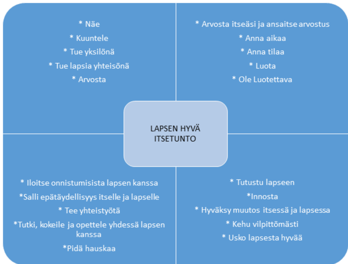
Kuvio 1. Mukailten Vehkalahti 2007.