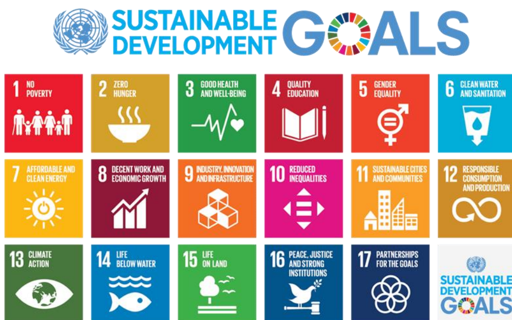
Kuva 1. Kestävän kehityksen tavoitteet. (Yhdistyneet kansakunnat. Communications materials.)

Yhdistyneiden kansakuntien (2018, 4) julkaisemassa raportissa The Sustainable Development Goals Report 2018 tarkastellaan Agenda 2030 -toimintaohjelman tämänhetkistä toteutumista. Siinä käsitellään 17 eri kestävän kehityksen tavoitteen tilaa. Yhdistyneiden kansakuntien kestävän kehityksen tavoitteita on esitetty kuvassa 1.