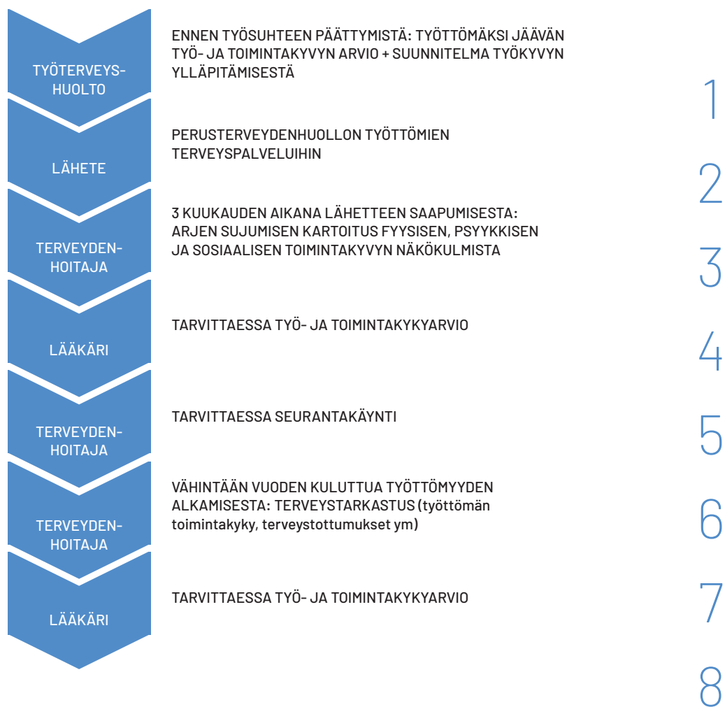
KUVIO 2. Toimintamalli työttömän työ- ja toimintakyvyn oikea-aikaiseen ylläpitämiseen ///