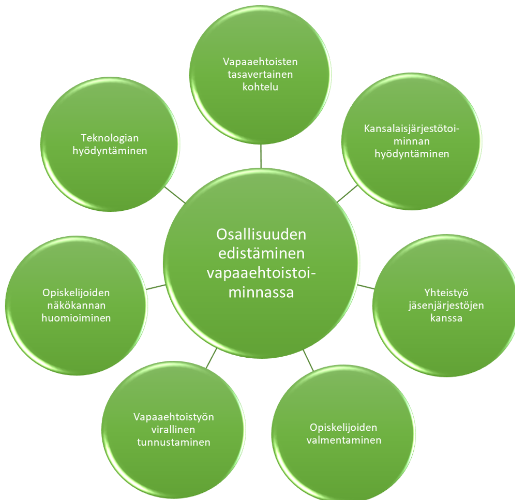
Kuvio 3: 15–18-vuotiaiden opiskelijoiden osallisuuden edistäminen vapaaehtoistoiminnassa

kat vapaaehtoisten tasavertainen kohtelu, kansalaisjärjestötoiminnan hyödyntäminen, yhteistyö jäsenjärjestöjen kanssa, opiskelijoiden valmentaminen, vapaaehtoistyön tunnustaminen virallisesti, teknologian hyödyntäminen ja opiskelijoiden näkökannan huomioiminen.