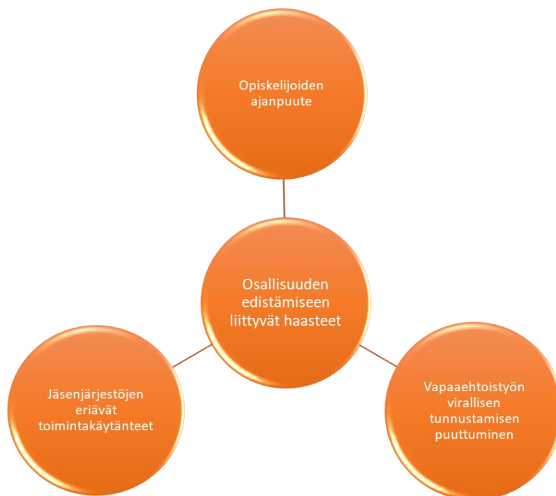
Kuvio 4: 15–18-vuotiaiden opiskelijoiden osallisuuden edistämiseen liittyvät haasteet

Aineiston analyysin tuloksena muodostui kolme alaluokkaa, joita ovat vapaaehtoistyön virallisen tunnustamisen puuttuminen, opiskelijoiden ajanpuute ja jäsenjärjestöjen eriävät toimintakäytänteet. Nämä alaluokat kuvaavat 15–18-vuotiaiden opiskelijoiden osallisuuden edistämiseen liittyviä haasteita vapaaehtoistoiminnassa.