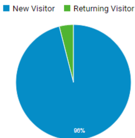
Kuva 2. Uusien ja palaavien käyttäjien suhde Theseuksen käyttäjistä

Yleiskatsaus Theseuksen käyttöön vuonna 2018 Google Analyticsin kautta kertoo käyttäjiä olleen kaikkiaan 18 795 266. joista uusia 18 590 778. Uudelleen Theseusta käyttämään palasi 204 488 käyttäjää.