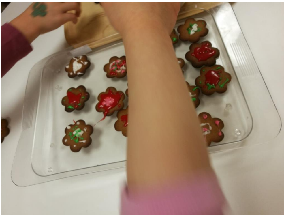
Kuva 2. Piparien koristelupiste

Ainola-salissa odotti jo joukko vanhuksia, jotka olivat kyseisen Harjulakodin asukkaita. He olivat yhdessä palvelukoordinaattorin kanssa jo laittaneet leipomistarvikkeet ja taikinat valmiiksi, osa pipareistakin oli jo paistettu. Näin saatiin aikaan kaksi eri pistettä itse leipomiselle ja valmiiden pipareiden koristelulle (kuva 2). Lapset jakautuivat innokkaina, mutta aluksi hieman arkoina pisteille. Lapsia toimintatuokioon osallistui seitsemän ja vanhuksia kuusi.