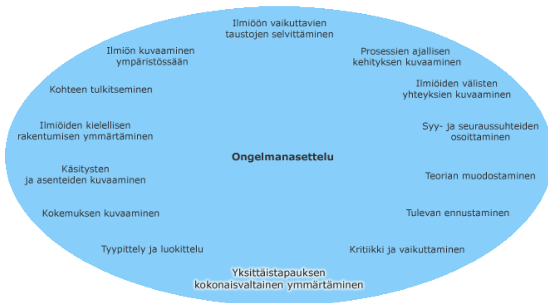
Kuva 1. Ihmistieteellisen tutkimuksen ominaisuuksia havainnollistava malli (Jyväskylän yliopisto 2009.)