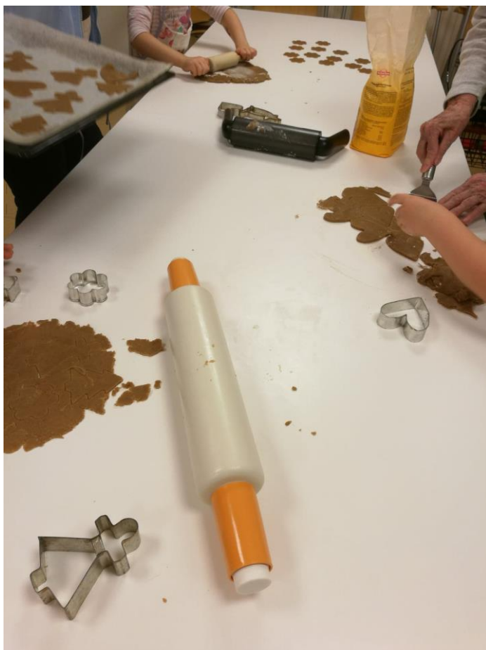
Kuva 3. Lapset ja vanhukset yhdessä leipomassa

Leipomispisteen ilo oli silmin havaittavaa. Lapsia rohkaistiin vanhusten toimesta kaulimaan ja kokeilemaan itse, mutta apua sai heti kun siltä tuntui (kuva 3). Välillä taikinaakin maisteltiin vaivihkaa. Hymyt olivat herkässä ja kaikki pääsivät osallistumaan taitojensa ja toimintakykynsä mukaan. Jos ei jaksanut seistä, välillä istuttiin katselemaan ja juttelemaan.