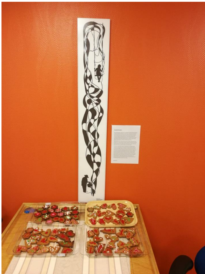
Kuva 4. Valmiiden pipareiden tarjoilupiste

Toimintatuokion kesto oli yhteensä noin 45 minuuttia. Heti tuokion perään Ainola-salissa alkoi toinen ohjelmanumero vanhuksille, joten valmiita pipareita pääsivät ihastelemaan muutkin Harjulakodin asukkaat kuin leipomiseen osallistuneet.