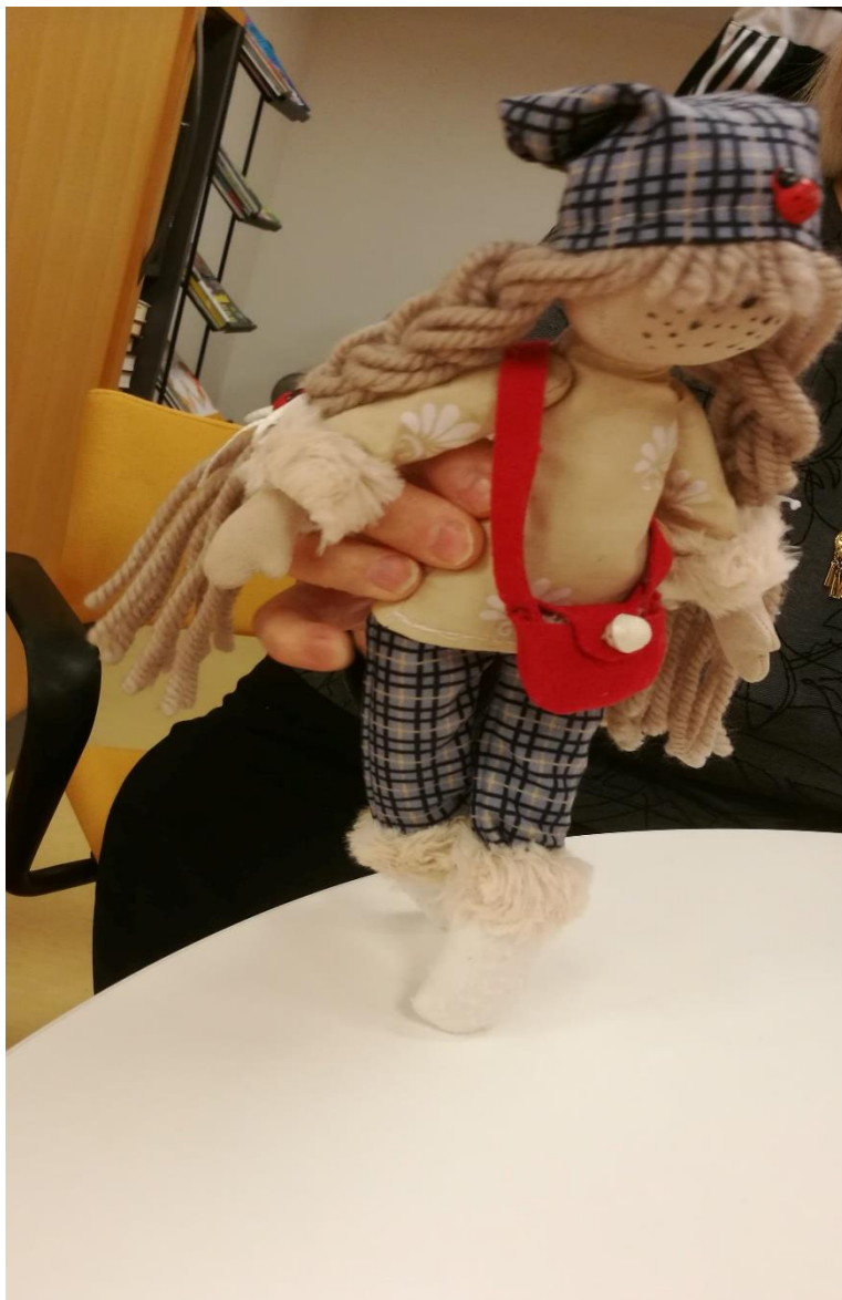
Kuva 6. Senioritalon asukkaan mukaan ottama lelu

Lopuksi laulettiin yhdessä vielä muutama toivelaulu, jotka olivat kaikille tuttuja. Toimintatuokio oli luonteeltaan hyvin erilainen kuin edellinen, mutta ilo ja lämmin tunnelma oli yhtä hyvin läsnä kuin edellisessäkin.