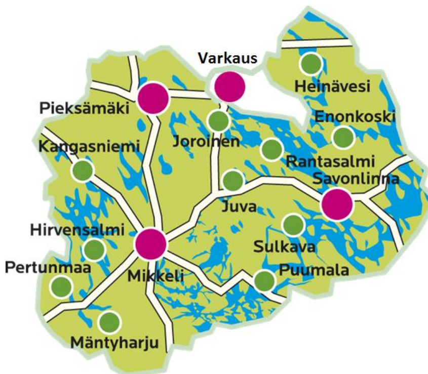
Kuva 1. Etelä-Savon maakuntaliitto

(Eteläinen kenttäjohtoalue, kuvaan lisätty Varkauden seutu. Suuntana Saimaa, kunnat ja kaupungit, luettu 14.1.2019)