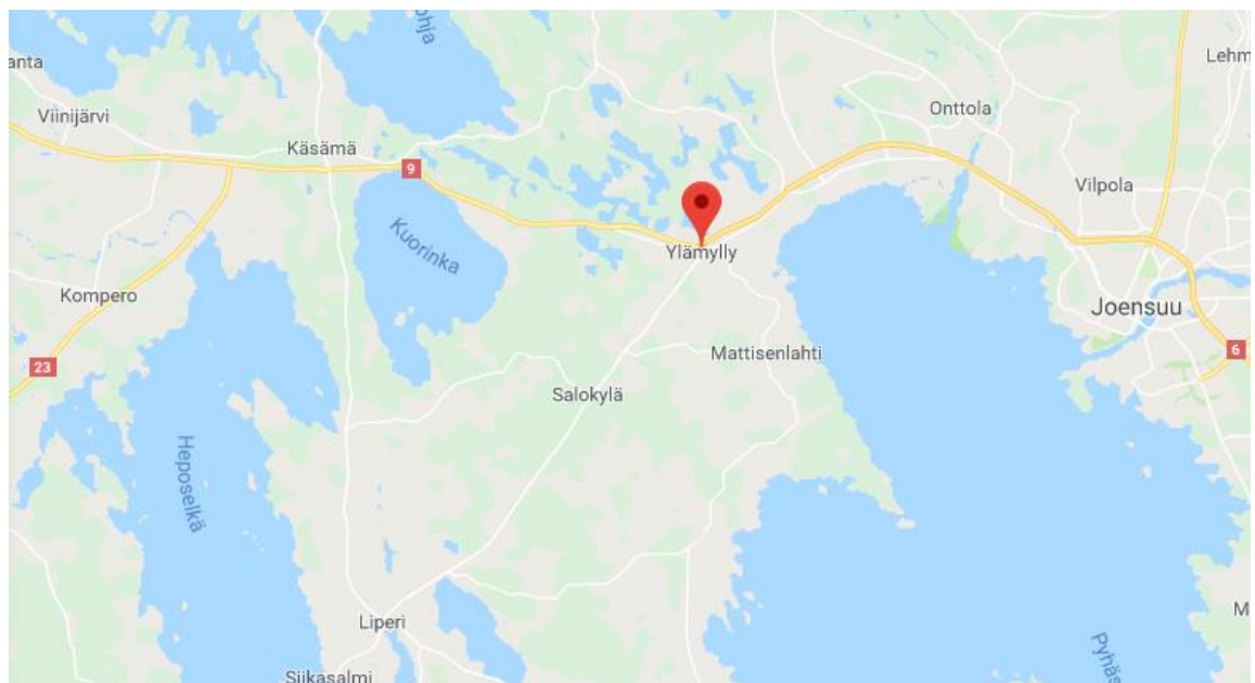
KUVA 1. Ylämylly kartalla

Ylämylly sijaitsee noin 15 kilometriä Joensuun kaupungista länteen. Liikenneyhteydet ovat hyvät, sillä Ylämyllyn kautta kulkee merkittävä valtatie. Valtatiet 23 ja 9 Varkauden ja Kuopion suuntiin kulkevat Ylämyllyn kohdalla samaa reittiä. Ylämyllyltä Liperin kirkonkylälle kulkee seututie 476, jonka kautta Liperin kirkonkylältä kuljetaan Joensuun suuntaan. Oheisessa kuvassa näkyy Ylämyllyn taajaman sijainti (kuva 1).