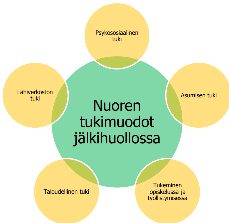
KUVIO. 4 Nuoren tukimuodot jälkihuollossa

Kuviossa 4 näkyvät jälkihuoltoon kuuluvat tukimuodot. Kaikkien osa-alueiden huomioiminen on tärkeää autettaessa nuorta itsenäiseen elämään. Jokaisen nuoren tarpeet tulee ottaa huomioon yksilöllisesti, koska heidän valmiutensa ovat hyvin erilaisia. Osalle riittää vähempi tuki ja osa tarvitsee tukea enemmän selviytyäkseen arjessa.