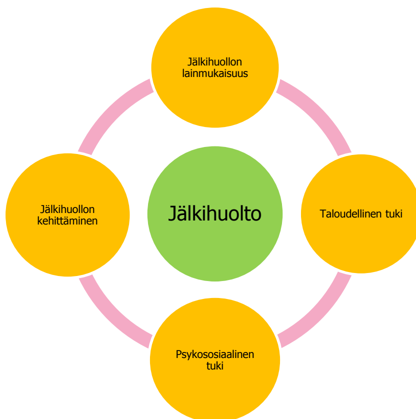
KUVIO. 1 Teemahaastattelun teemat