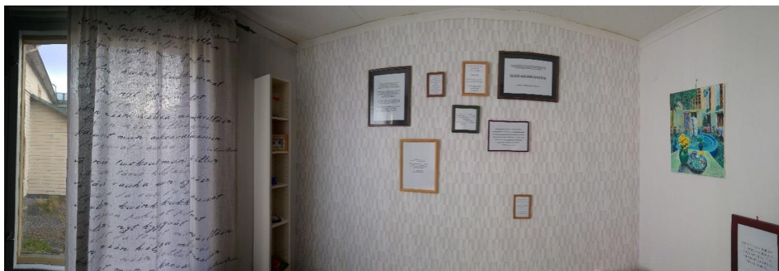
Kuva 3. Osa Room 4 -tilataideteoksesta / Uudenkaupungin toteutus. Maalaus seinällä: Bakhtiar Ismail. Valokuva: Seija-Leena Salo

Teoksen konkreettisesta ja kokemuksellisesta olemuksesta on vaikea antaa selkeää kuvaa tekstin muodossa, joten olen liittänyt teosta koskeviin lukuihin myös valokuvia. Vaikka kolmiulotteista tilaa on vaikea kuvata kaksiulotteisin valokuvin, toivon kuvien kaikessa rajallisuudessaan valottavan teoksen luonnetta hieman lisää.