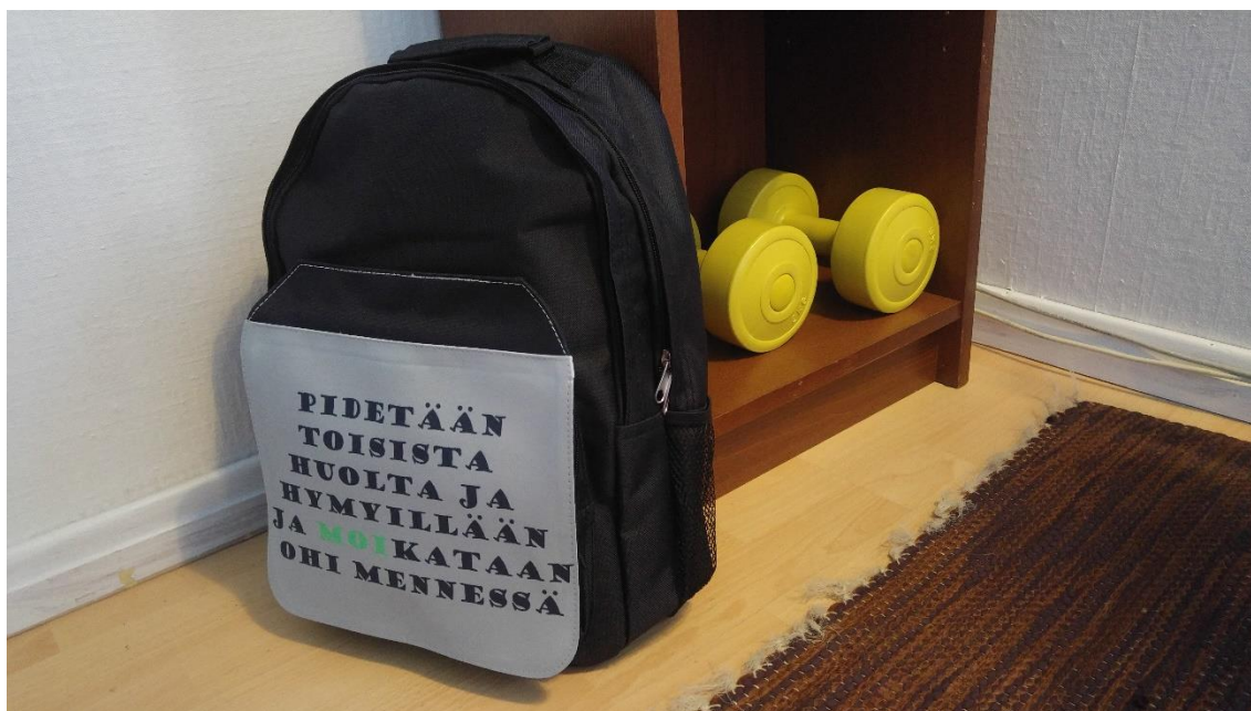
Kuva 4. Room 4:n yksityiskohta / Uusikaupunki.

Pääosan Room 4 -haastatteluista äänitin ja litteroin. Yksi haastattelu tapahtui pelkästään viesteillä ja yhdestä tein vain kirjalliset muistiinpanot. Kohtaamisten pituus vaihteli noin 20 minuutista kahteen tuntiin. Haastattelumuistiinpanoja ja litteroitua materiaalia kertyi paljon enemmän kuin taiteelliseen kokonaisuuteen oli mielekästä liittää.