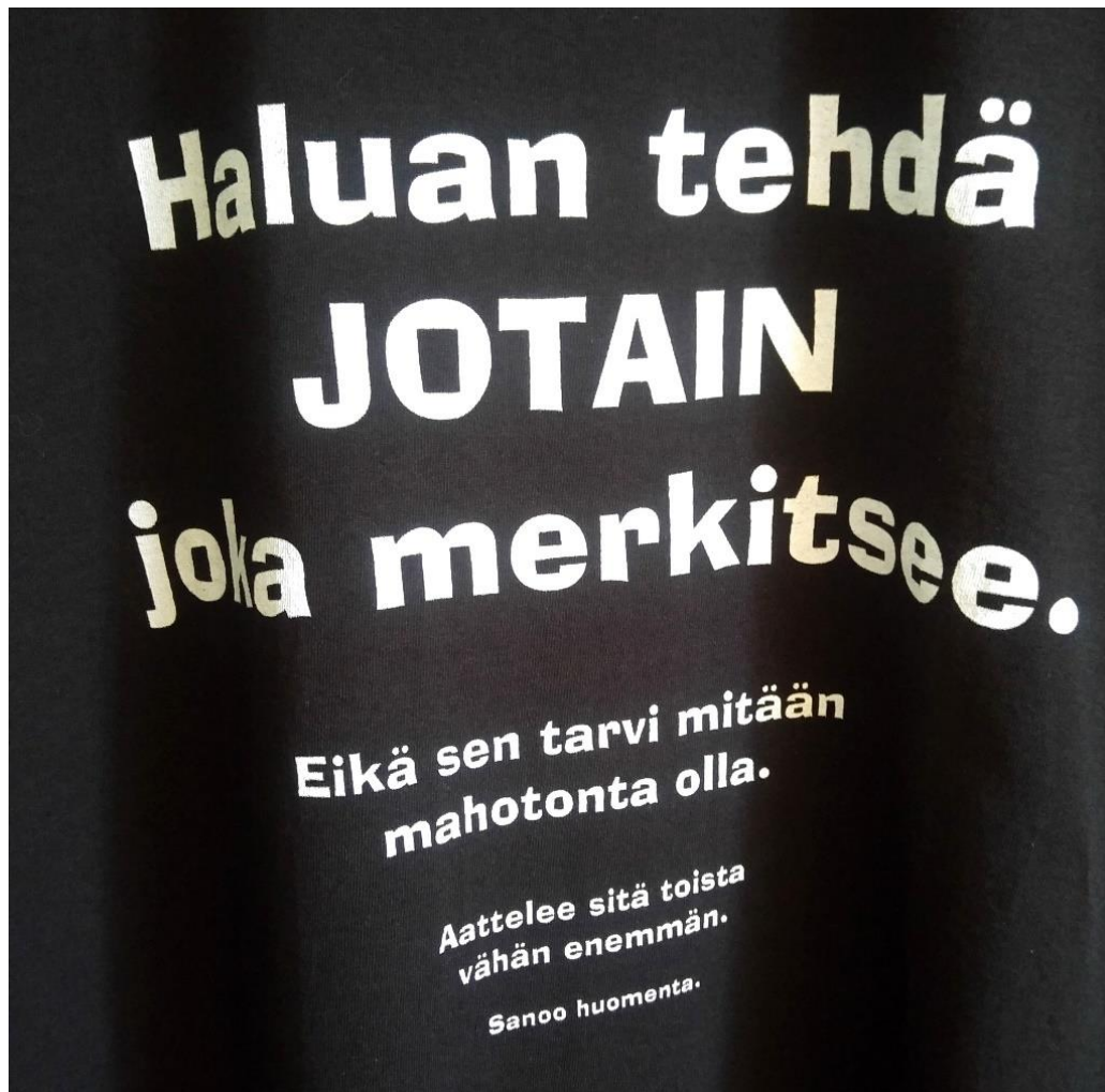
Kuva 8. Paidan teksti. Room 4:n yksityiskohta.

Unelmia kodista ja asumisesta: Haastattelemani uusasukkaat toivat esiin myös hyvin konkreettisia unelmia. Asuntopulaa potevalla seudulla monet näistä unelmista liittyivät asumiseen.