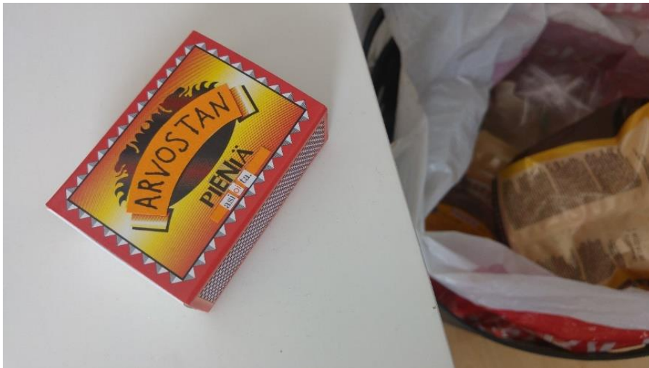
Kuva 6. Arvostan pieniä asioita. Room 4:n yksityiskohta.

Mä elän päivä kerrallaan ja teen mitä tänään täytyy. Huomenna on uusi päivä. (Mukin teksti, Room 4:n yksityiskohta)