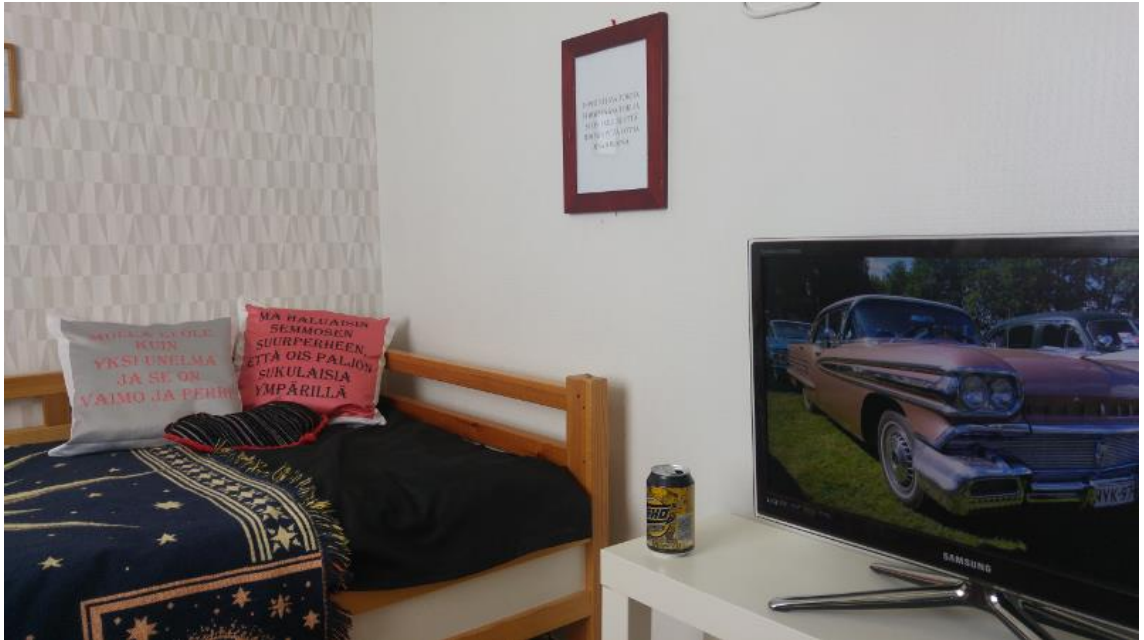
Kuva 2. Osa Room 4 -tilataideteoksesta / Uudenkaupungin toteutus.

Asukasluotsaus-työni mittavimmaksi ja näkyvimmäksi ulostuloksi muodostunut Room 4 – some (un)necessary objects, some necessary dreams -teos oli tilasidonnainen installaatio, asunnoksi sisustettu huone, jossa yleisö saattoi vieraillla. Teos oli yleisön koettavissa kahtena eri versiona, 26.7.–31.8.2018 Uudessakaupungissa ja 3.–31.10.2018 Laitilassa. Näyttelyselosteessa kuvasin teosta seuraavasti: