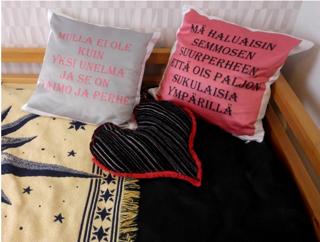
Kuva 7. Room 4:n yksityiskohta.

Muihin sosiaalisiin suhteisiin liittyviä kokemuksia ja ehdotuksia: Haastattelemillani ihmisillä oli erilaisia kokemuksia siitä, miten aikuisena ihmisenä löytää ystäviä uudesta asuin- ympäristöstä. Oman aktiivisuuden ja paikkakuntalaisten vastaanottavaisuuden roolia kotiutumisen pohdittiin.