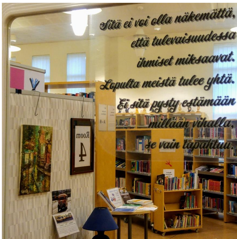
Kuva 13. Room 4:n yksityiskohta / Laitilan kirjasto. Maalaus: Bakhtiar Ismail. Seinäkalenteri: Sauli Vähäkoski. Teoskuva: Seija-Leena Salo