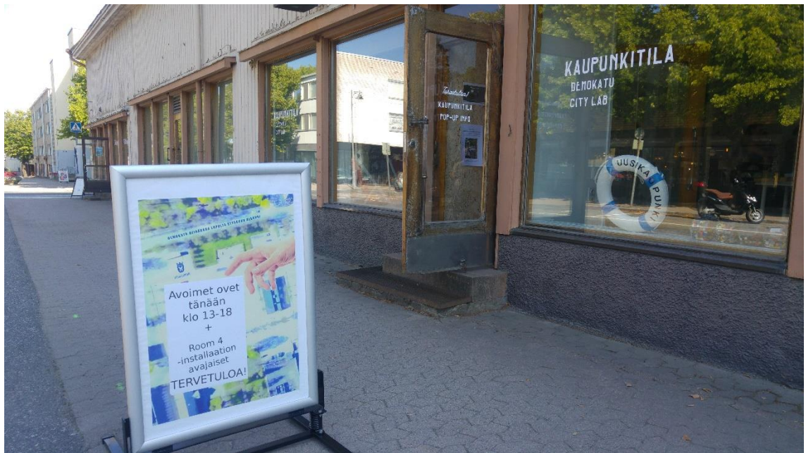
Kuva 1. Room 4:n avajaiset Demokatu-hankkeen Kaupunkitilassa Uudessakaupungissa.

Room 4:n toteuttamismahdollisuuden lisäksi Demokatu-yhteistyö vahvisti Asukasluotsauksen verkostoja Uudessakaupungissa. Asukasluotsauksen panostuksella taas oli vaikutusta esimerkiksi Demokatu-hankkeen monikulttuuriseen antiin. Projektipäällikkö Salonen kutsui kotoutumiskoulutuksen ryhmän Demokadun talkoisiin sekä koordinoi kansainvälisen Confusion Kitchen -ruokatapahtuman osana Demokadun tapahtumakonaisuutta.