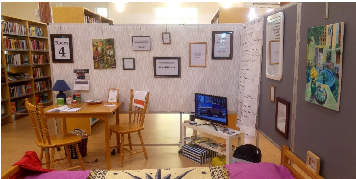
Kuva 12. Osa Room 4 -tilataideteoksesta / Laitilan kirjasto. Maalaukset: Bakhtiar Ismail. Valokuva televisiossa ja seinäkalenteri: Sauli Vähäkoski. Teoskuva: Seija-Leena Salo

sisään sen ainoasta ovesta kuten asuinhuoneeseen. Laitilan versioon toivottiin enemmän ohikulkijakäyntejä, eli avoimempaa tilaa, johon satunnainenkin kulkija voisi löytää. Yhteistyö syntyi lopulta Laitilan kirjaston kanssa.