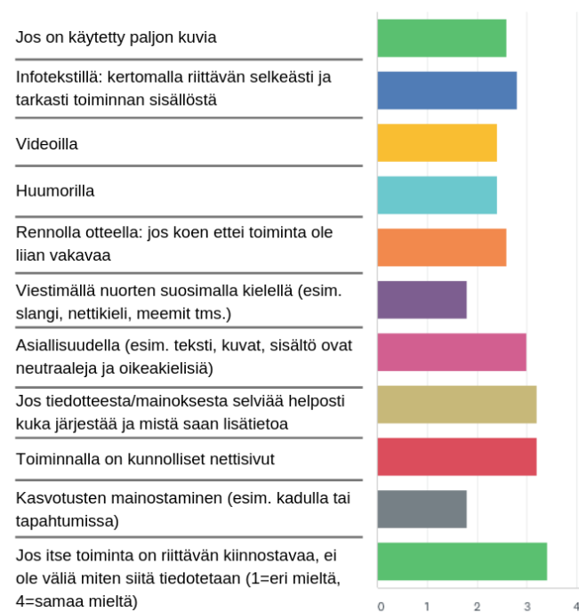
Kuvio 7: Nuorten mielipiteet erilaisten markkinoinnin lähestymistapojen toimivuudesta