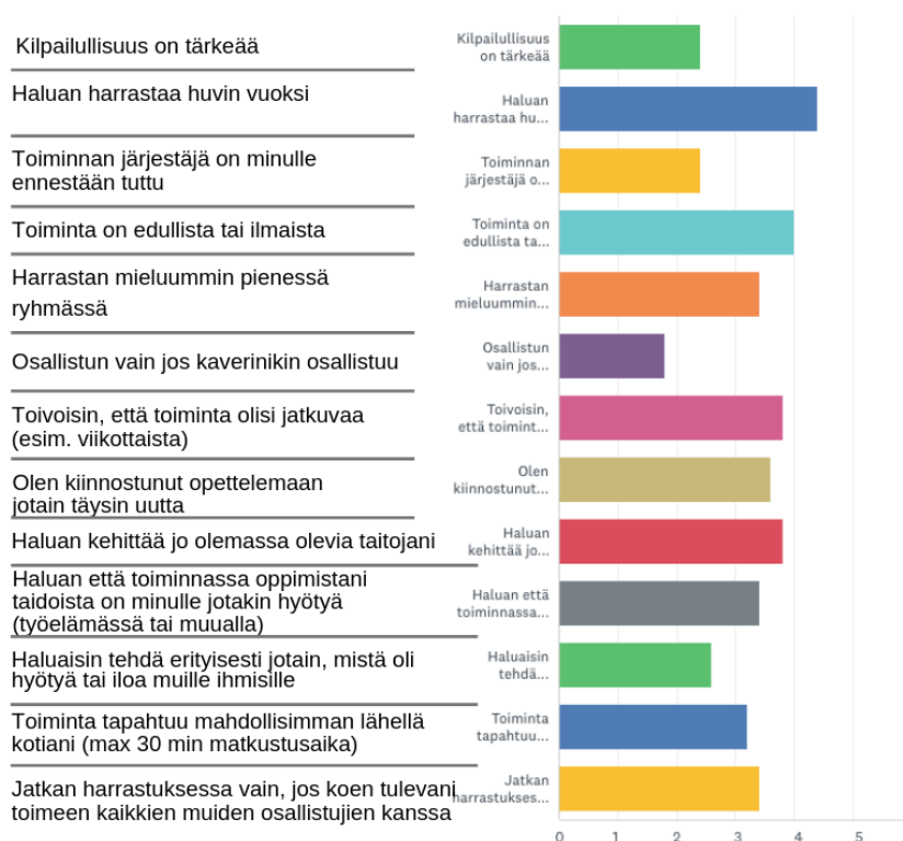
Kuvio 6: Toimintaan osallistumiseen vaikuttavia tekijöitä