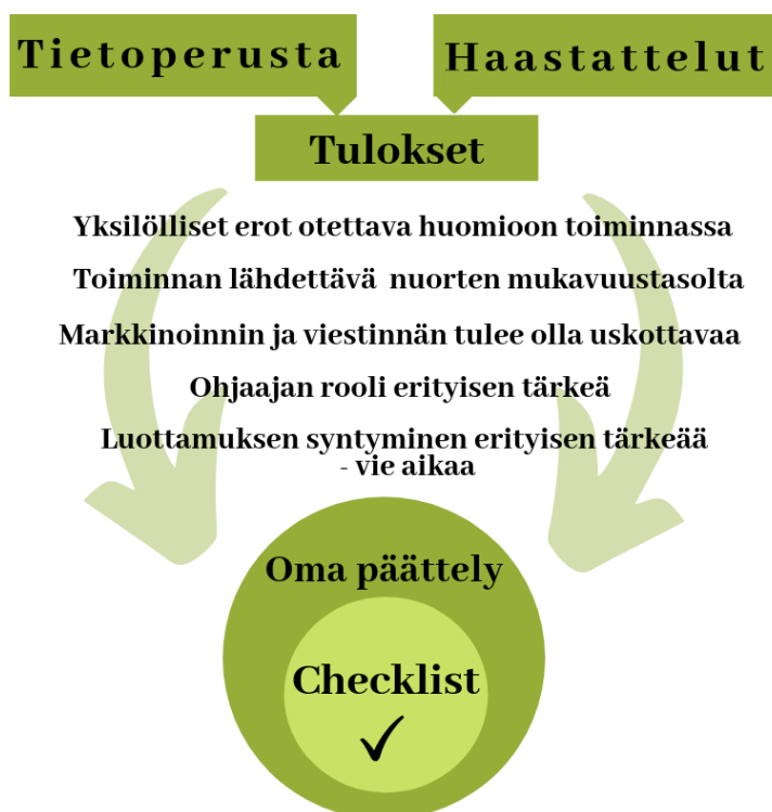
Kuvio 8: Polku lopputuotokseen

Tässä kappaleessa kerron Checklist -vinkkityökalusta, joka muotoutui tilaajan toiveen ja tutkimustulosten perusteella opinnäytetyöni lopputuotteeksi (Kuvio 8). Lisäksi kerron tilaajalle antamani kehitysehdotukseni.