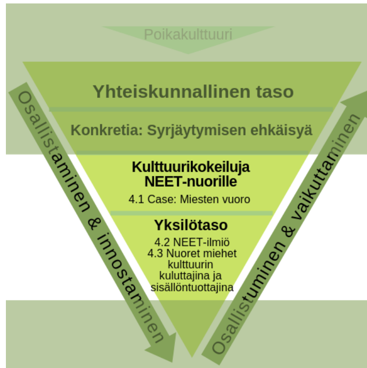
Kuvio 5: Luvun 4 aiheet ja kappaleet

Tässä luvussa kerron aluksi opinnäytetyöni tilaajasta ja siitä tarpeesta, johon perustan tutkimukseni. Luvun toinen alaluku kuvaa NEET-nuorten omaa kokemusta. Kolmas ja samalla tietoperustani viimeinen alaluku käsittelee nuoria miehiä kulttuurisisältöjen kuluttajina ja tuottajina. Tietoperusta lähestyy ruohonjuuritasoa ja esittää esittämäni kolmion kahta alimmaista osaa (Kuvio 5). Yksilön tasoa lähestyttäessä on mielestäni tärkeää pitää mielessä ympäristön luomat mallit ja arvot. Kolmion tiivistävä kärki kuvaa itselleni myös sitä, miten yksilön rooli on liikkumavaraltaan melko ahdas ja tietyllä tavalla yhteisön painoa harteillaan kannatteleva. Tältä alimmalta tasolta olisi osallistavan – kuten esimerkiksi Miesten Vuoro -hankkeen – toiminnan tarkoitus saada aikaan ylöspäin johtava liike: innostuminen ja osallistuminen yhteiskuntaan.