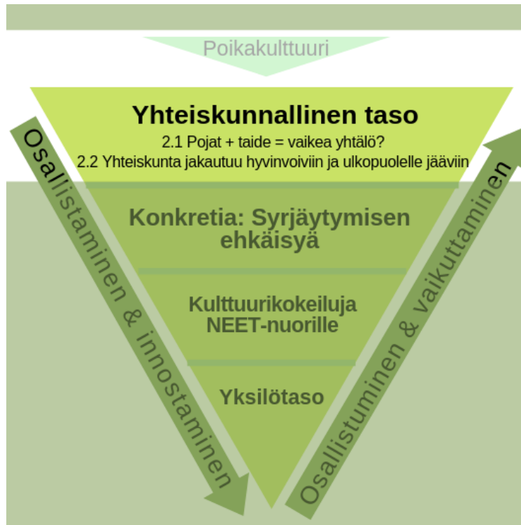
Kuvio 2: Luvun 2 aihe ja kappaleet

Tämä luku kuvaa esittelemäni kolmion ylimpiä kerroksia (Kuvio 2): poikakulttuuria ja yhteiskunnallista tasoa. Se käsittelee nuorten työ- ja koulutuspaikkaa vailla olevien miesten asemaa suomalaisessa yhteiskunnassa sekä sitä, miten aihetta julkisessa keskustelussa käsitellään. Aluksi kuitenkin pohjustan aihetta avaamalla poikakulttuurin juuria suomalaisen kulttuurin kautta. Mielestäni on tärkeää ymmärtää ilmiön taustaa ja historiaa, jotta voidaan yrittää lähteä hahmottelemaan nykymiehen maailmaa. Tämän jälkeen avaan aiheesta käytävää julkista keskustelua.