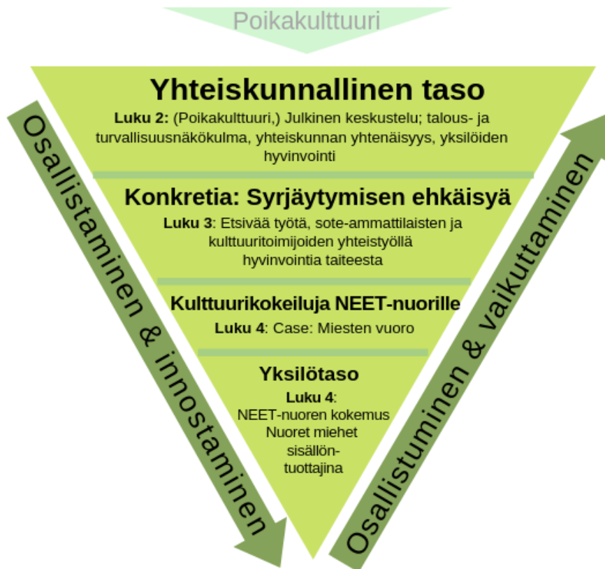
Kuvio 1: Opinnäytetyön rakenne. NEET-nuoret: osallistamisesta osallistumiseen

Kolmiota luetaan ylhäältä alaspäin. Kuvaan koko ilmiötä kärjellään seisovana kolmiona havainnollistaakseni sen, miten näkemykseni mukaan yhteiskunnan ylätasolla tehdyt päätökset vaikuttavat laajalti kaikkeen yksilöä ohjaavaan toimintaan. Toisaalta näkisin, että yhteiskunta toimii yksilöidensä varassa. Sen vuoksi vaikutukset kulkevat molempiin suuntiin, mitä kuvaavat kolmion sivuilla olevat nuolet. Vasemmalla sivulla alaspäin kulkeva nuoli kuvaa järjestelmän korkeimmilta portailta yksilöä kohti kulkevia osallistamisen ja innostamisen teemoja. Osallistamiseen ja innostamiseen pyrkivän toiminnan tavoitteena on saada aikaan yksilön innostuminen ja osallistuminen sekä lopulta vaikuttamisen halu, mikä näkyy oikealla kyljellä kulkevassa nuolessa. Esittelen Miesten vuoro -hankkeen tarkemmin vasta neljännessä luvussa, koska se sijaitsee kolmiossa lähempänä yksilön tasoa.