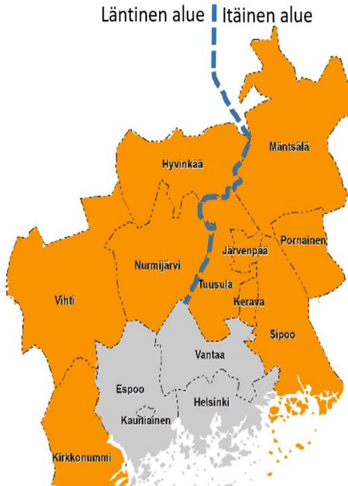
Kuva 1. KUUMA-kuntien aluejako itäiseen ja läntiseen alueeseen.

Taustatieto-osiossa työryhmä halusi selvittää päiväkodinjohtajien taustaa, kuinka kauan on toiminut yksityisellä sektorilla ja kuinka monta ryhmää johdettavana ja toimiiko esimiestyön lisäksi ryhmässä lastentarhanopettajana. Taulukossa 2 vastaukset on eritelty itäisen ja läntisen alueeseen.